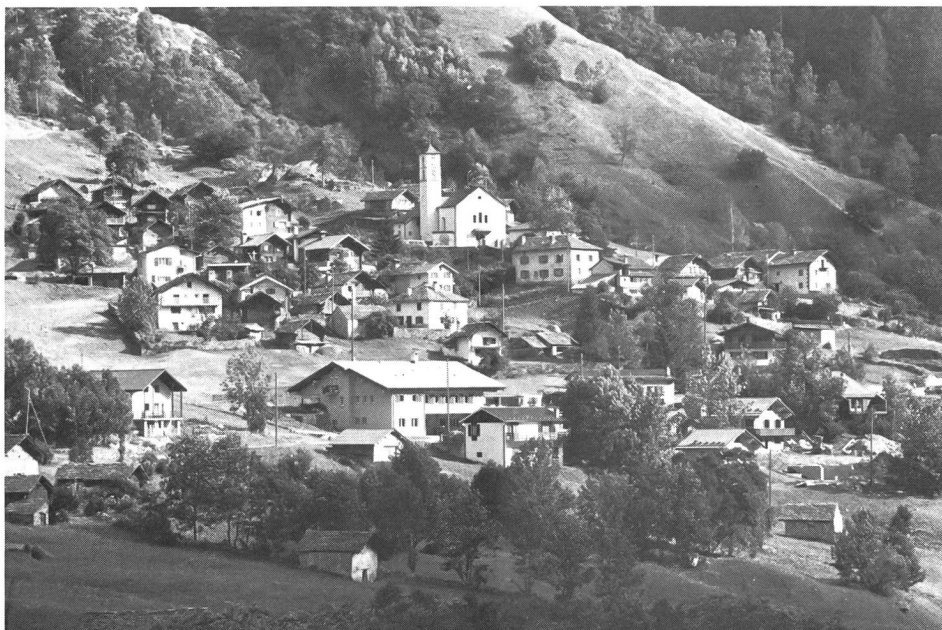
Le village de Selma dans le Val Calanca avec, au premier plan, la nouvelle auberge de jeunesse.

Pour ma part, avec les moyens de bord dont je dispose (auberge de jeunesse et autres possibilités d'hébergement, tels que la transformation de bâtiments scolaires désaffectés en lieux de camps) j'essaie d'«importer le sport» dans cette région tout en favorisant le tourisme sous la forme d'un retour à la nature. J'ose croire que ceux qui auront goûté du Val Calanca dans leur jeunesse y reviendront plus tard, avec leur propre famille».