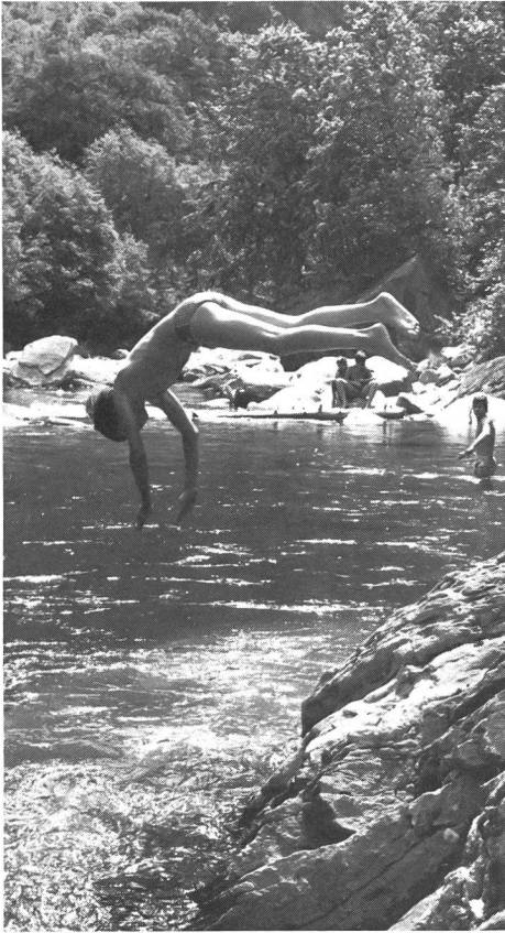
Tête la première dans la Calanca.

vallée. Directement à côté de l'auberge, un terrain de football a pu être préparé grâce à l'aide des machines utilisées pour la construction de la route et que l'entrepreneur, ébahi d'admiration pour ce «diable de petit curé», accepta de mettre à sa disposition. Lorsque je lui demandai de m'apporter quelques précisions sur la façon dont il est possible de faire du sport aux jeunes dans le Val Calanca, je vis ses yeux s'allumer et s'assombrir tour à tour. Voici ce qu'il me répondit: «Les conditions ne sont pas requises pour qu'il y ait, ici, un sport