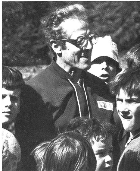
Le curé et ses ouailles sportives.

Texte et photos: Hugo Lörtscher Traduction: Yves Jeannotat