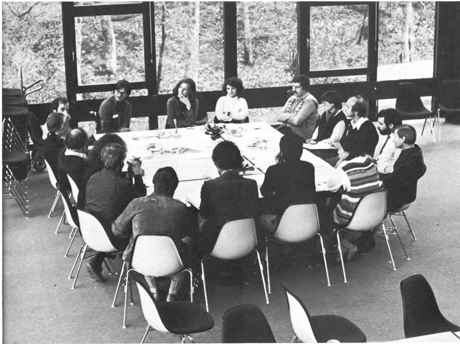
L'importance du travail de groupe.