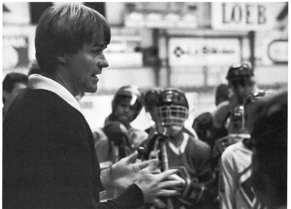
Le rayonnement de l'entraîneur.

Si, lors de la réunion plénière, l'un ou l'autre participant s'attendait peut-être à recevoir davantage d'informations de la part des spécialistes présents, tous ont reconnu que les trois jours de cours passés à Landersheim avaient été une réussite. Plusieurs éléments y ont contribué: les entretiens de groupe, en premier lieu, toujours constructifs parce que donnant aux entraîneurs l'occasion de procéder à des échanges d'expériences, la bonne ambiance, ensuite, due en grande partie à l'accueil simple et chaleureux d'«Adidas-France», la qualité de l'organisation, enfin, à mettre au compte d'Ernst Strähl. ■