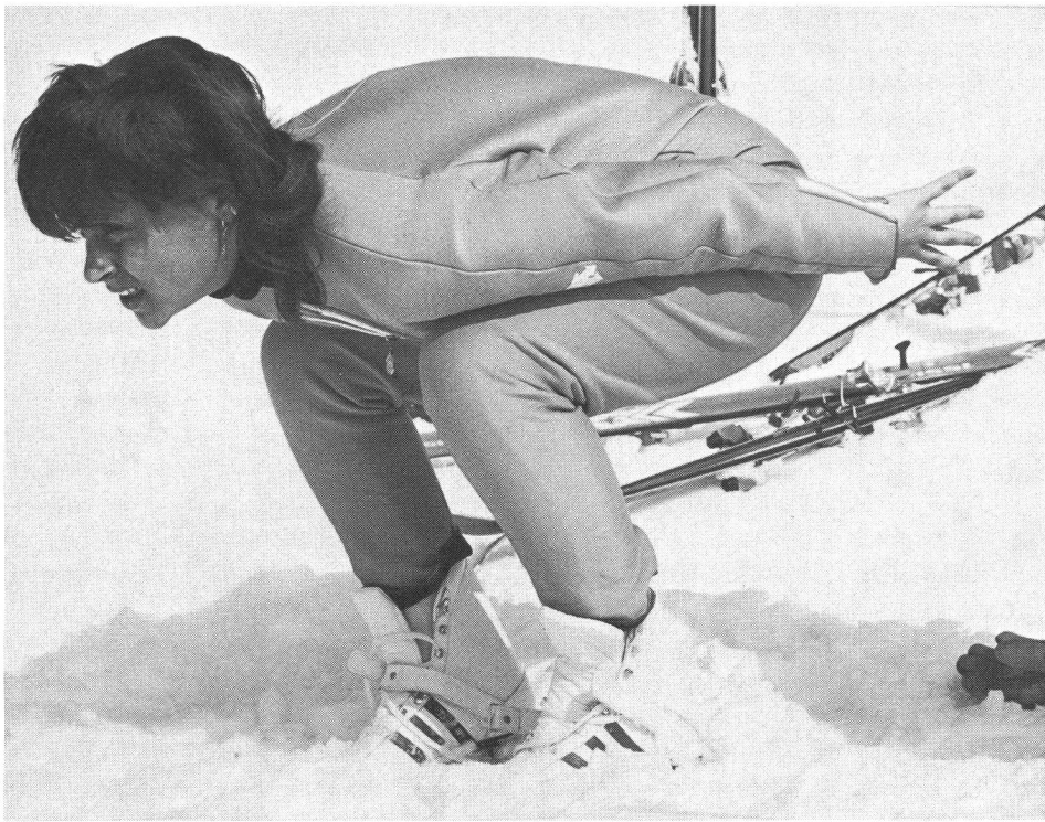
Recherche constante de la bonne position...

MACOLIN: Lorsque les membres de l'équipe nationale ou d'autres délégations s'entraînent à Kandersteg, as-tu l'autorisation de te joindre à eux?