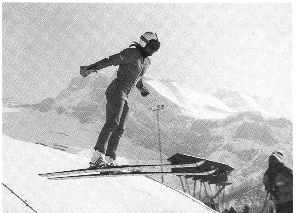
...mais elle saute!