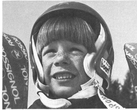
La peur? Connais pas...

Sur le plan purement visuel, on peut avoir l'impression que, durant la phase aérienne, le sauteur est livré sans défense aux éléments. Ce faisant, on sous-estime la vitesse de vol (80 à 100 km/h), et la pression qui s'exerce sur les skis, longs de 2,5 mètres et larges de 11 centimètres. Le sauteur connaît ces forces, de même que les possibilités dont il dispose pour contrôler son vol. La position du haut du corps et celle des bras sont des moyens directionnels suffisants pour le contrôle d'un saut normal. Pour des raisons diverses, telles qu'inattention, nervosité, influences extérieures, il peut arriver qu'un saut soit raté. Les deux fautes les plus fréquemment rencontrées lorsque c'est le cas sont: un angle d'envol trop grand (haut du corps trop relevé) ou un départ de la table d'envol avec une «rotation» avant trop prononcée. Ces deux fautes peuvent entamer la confiance en soi, car le sentiment d'insécurité qui en