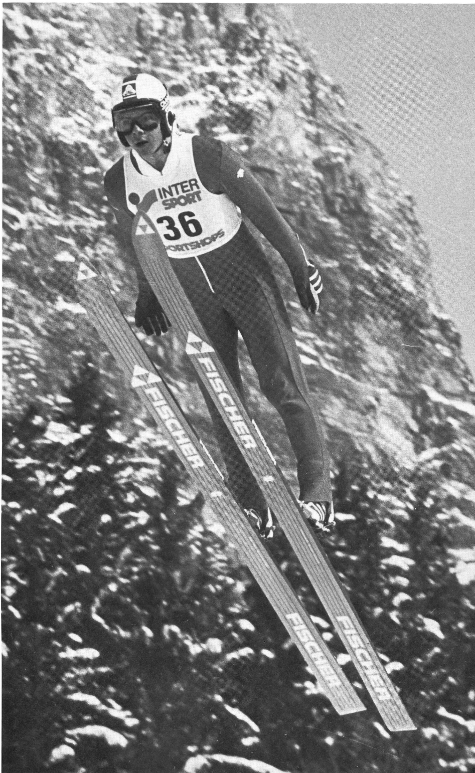
L'important, c'est l'expérience et la confiance.

En ce qui concerne la peur, les chutes ou «quasi-chutes» à la réception ont des conséquences plus lourdes que les autres, mais elles varient selon les individus. Il semble particulièrement important que l'athlète sache pourquoi il est tombé. S'il connaît la raison de sa chute, les conséquences, au niveau de la confiance en soi surtout, sont en général bénignes. Par contre, s'il l'ignore, il se posera de nombreuses questions difficiles à analyser et à digé-