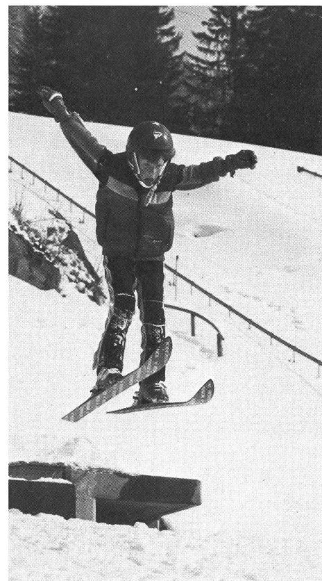
Première découverte du vide.

Qu'on soit spectateur ou débutant, il faut souvent une certaine dose de courage pour regarder, du haut d'un tremplin, en direction de la plate-forme d'envol et de l'aire de réception. L'idée que l'on parvient à at-