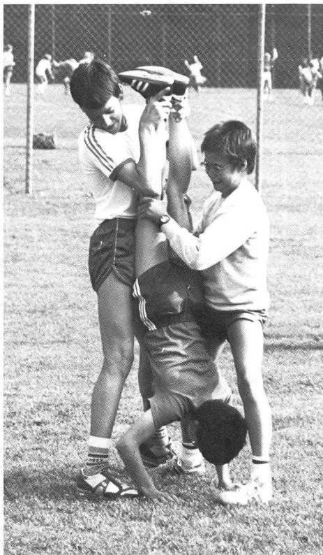
Laisser les gymnastes s'entraider...