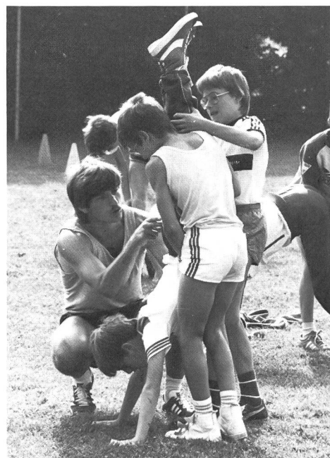
... et n'intervenir qu'en cas de nécessité.

Dans la salle d'entraînement aussi, l'aide mutuelle n'est pas un vain mot. Pour chaque activité, les moniteurs démontrent l'aide adéquate, précisent les attitudes correctes, puis laissent les gymnastes s'entraider, se surveiller, se corriger, n'intervenant qu'en cas de nécessité. Dans ce domaine aussi, l'encadrement est bien pensé. À côté des entraîneurs officiels,