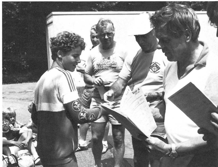
... la récompense.