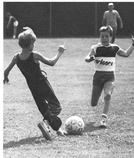
Pour changer, l'heure du ballon rond.

Le Camp de jeunesse suisse de gymnastique artistique est bien une entreprise audacieuse de l'AFGA; il permet une recherche d'équilibre entre les exigences sévères d'une discipline sportive difficile et la formation harmonieuse de jeunes sportifs qui sont avant tout, des êtres humains; il est aussi un pont jeté par des adultes responsables à la rencontre de jeunes qui le deviennent. ■