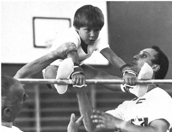
Après le travail...