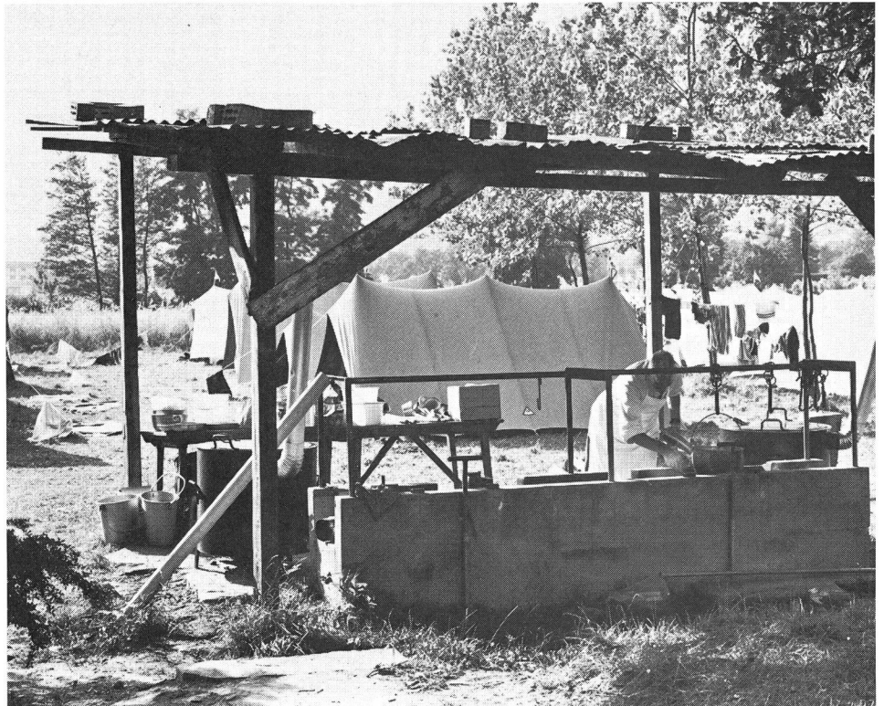
La vie de camp, une des caractéristiques du CST.

De juin à décembre 1976, le projet de construction fit l'objet d'une mise au concours publique. On enregistra 127 candidatures, dont 73 purent être définitivement retenues. Finalement, 50 candidats présen-