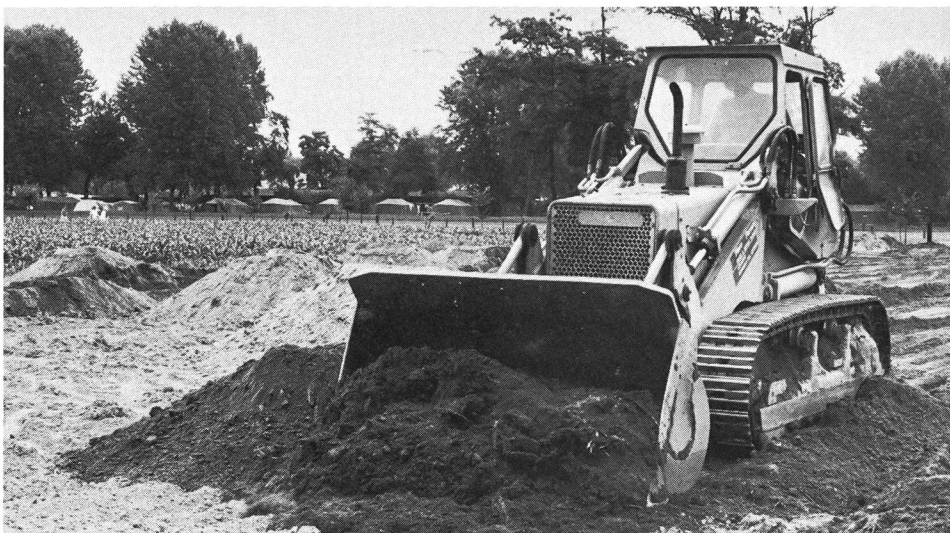
Travaux de remblayage.

Le déblocage des crédits connaissant quelques difficultés et le financement du projet détaillé et des travaux préparatoires prenant du retard, les spécialistes de la construction et de l'exploitation eurent suffi-