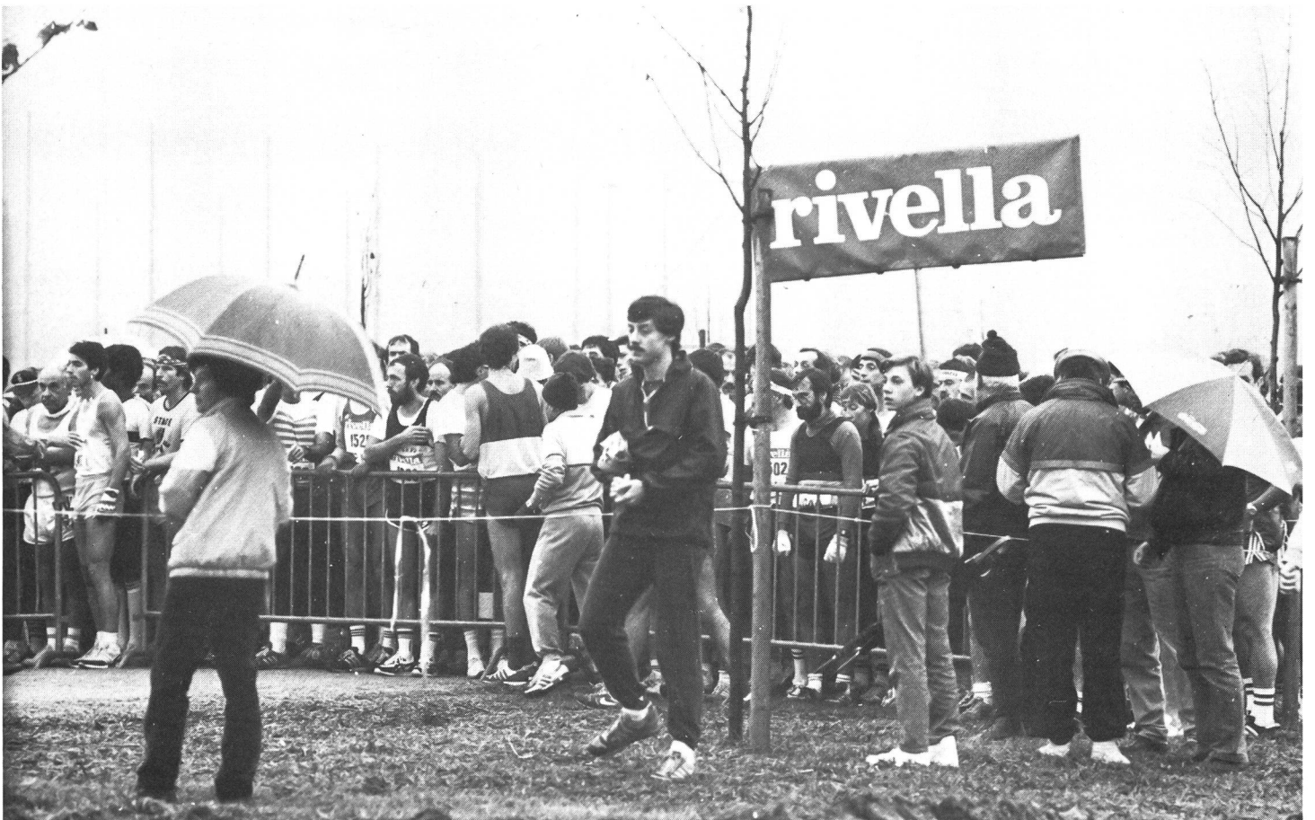
Ces photos ont été prises lors du championnat suisse de marathon à Tenero: «Départ dans trois minutes!»