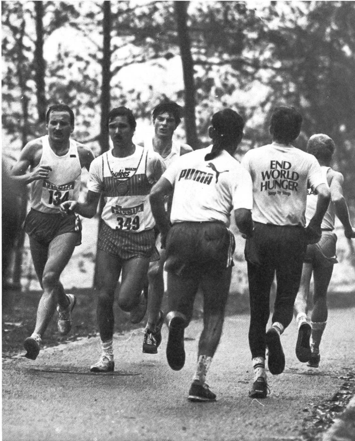
Le point de retour n'est pas loin.