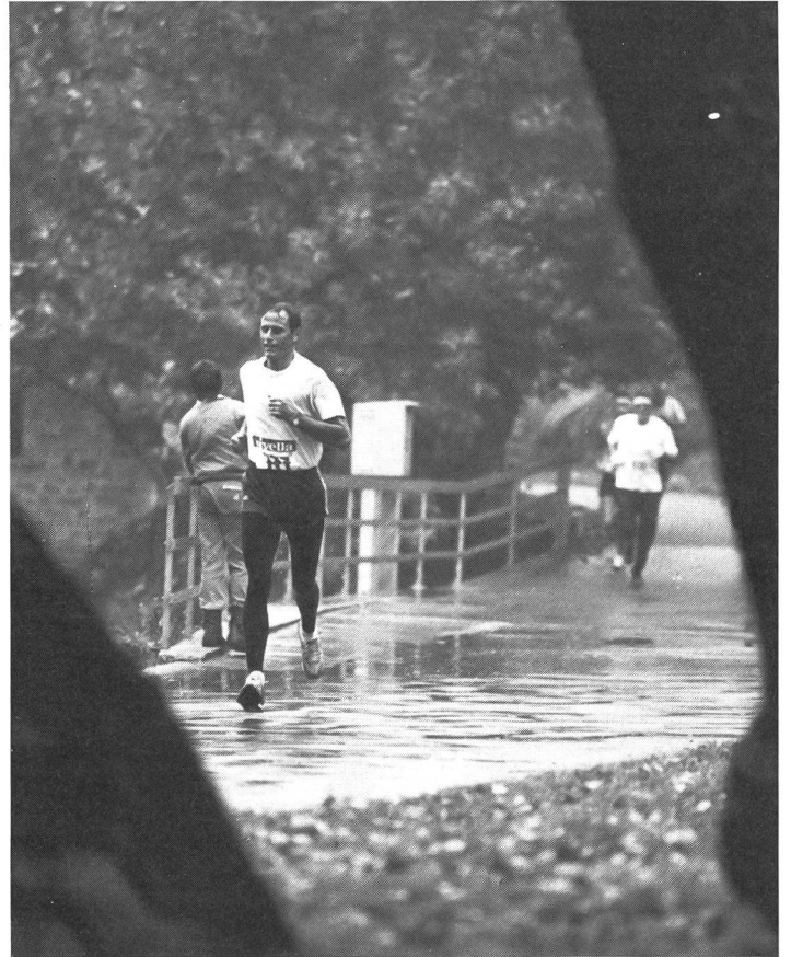
«Ça baigne dans l'huile.»

l'âme»; en d'autres termes, qu'ils donnent une représentation matérielle de l'invisible que chaque individu porte en soi. Le mouvement image notre intérieur, il extériorise les choses de l'âme, les fait reconnaître de façon plus concrète que ne le pourraient tous les mots de notre vocabulaire; échappant partiellement à notre système mental de contrôle, ce phénomène confirme notre existence, ce que Plessner appelle notre «être-au-monde» («In-der-Welt-Sein»).