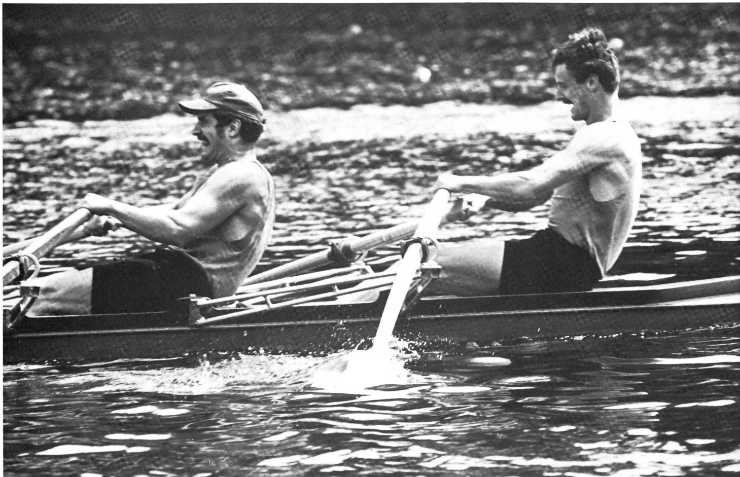
La volonté seule ne remplace ni la puissance aérobie...

l'Allemagne de l'Est à tenter une grande performance, donc à s'entraîner en conséquence, et ceci en tenant compte d'éléments susceptibles d'encourager le jeune homme ou la jeune fille concernés à prendre sur eux de se soumettre à la dure épreuve de la préparation: