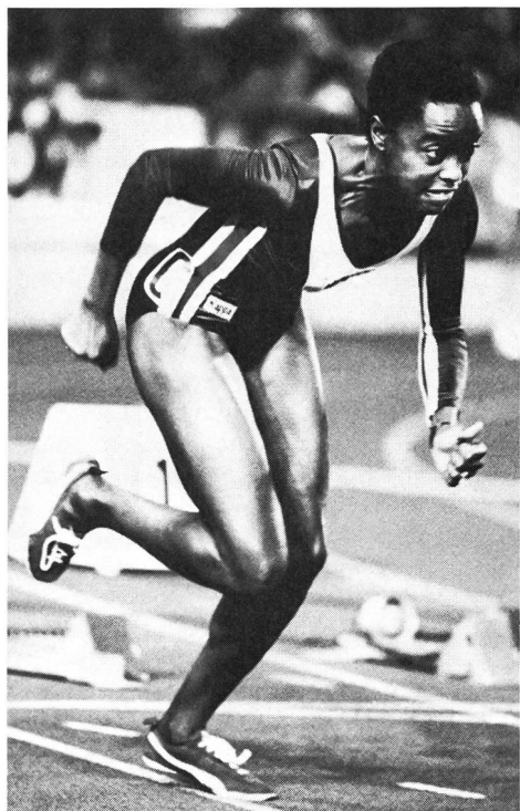
Evelyn Ashford, championne olympique: talent et détermination.

L'entraîneur ne doit pas dire à son athlète: «En 1986, tu vas courir le 400 m en 50 secondes» mais, de façon plus «imagée»: «En 1986, nous allons essayer d'atteindre la finale du championnat de Suisse».