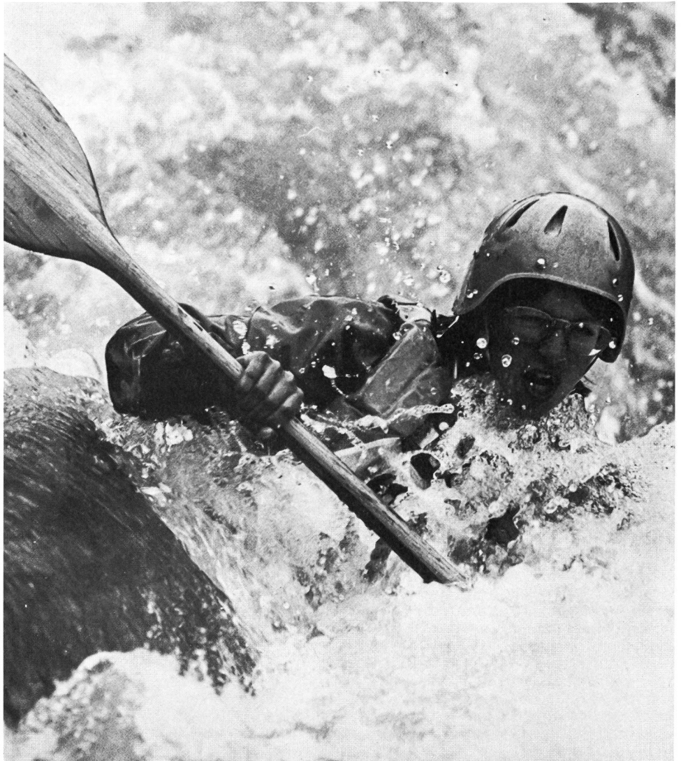
Dans tous les sports, la volonté participe à la victoire (Kathrin Weiss, Suisse, ancienne championne du monde par équipes).