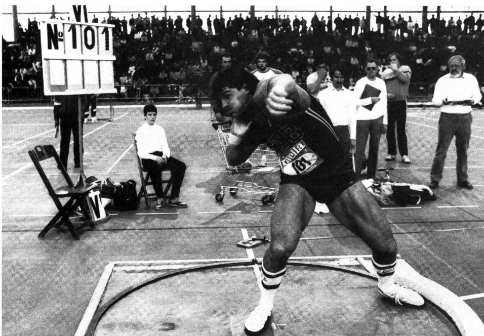
Werner Günthör, champion d'Europe en salle et... en plein air.

Me référant aux expériences que j'ai faites, au cours de ces dernières années, avec quelques lanceurs d'élite (Werner Günthör en particulier), lanceurs dont la forme dépend principalement du développement de la force maximale générale et de la force spécifique, je suis en mesure d'affirmer qu'il faut un minimum de 12 semaines de préparation pour amener un athlète en forme de compétition.