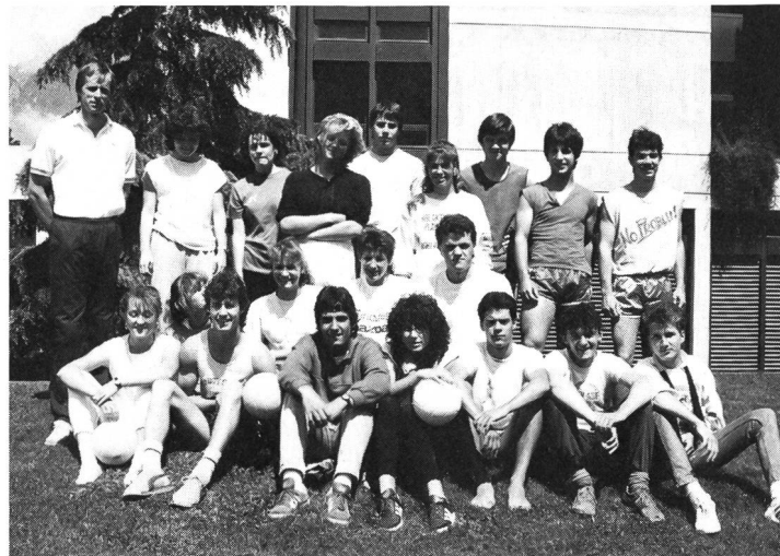
...et la classe d'artistes et de sportifs.

– il promet, de par ses résultats et ses prédispositions, de pouvoir faire carrière dans le domaine sportif ou artistique.