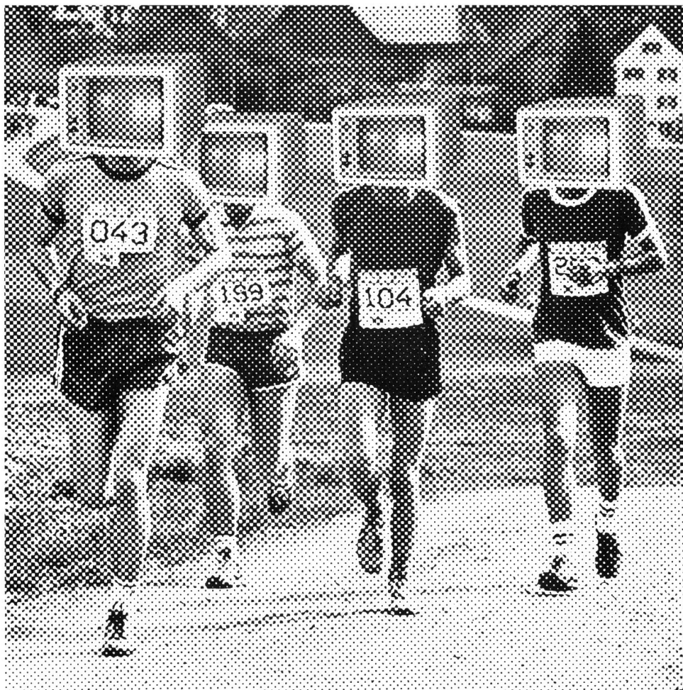
L'homme risque peu d'être robotisé par l'ordinateur à J+S.

Pour avoir une idée rapide et claire de la qualification d'un moniteur ou d'un cadre, il ne suffit pas de tirer la liste des cours de formation et de perfectionnement qu'il a réussis. De ce catalogue doit pouvoir être extrait un bref résumé de la reconnaissance concernée comportant la branche sportive, la spécialisation éventuelle, la catégorie et le statut. Ce dernier terme indique l'état de la qualification, à savoir si elle est «active» (le dernier cours enregistré date de moins de trois ans) ou «suspendue» sans être annulée (le dernier cours date de quatre à six ans). Ceci explique pourquoi les fichiers de moniteurs et ceux des cadres doivent être exploités séparément. En effet, il est possible qu'une même personne, dans la même branche sportive, bénéficie de deux reconnaissances de statut différent. Lors de la fixation du statut, il faut aussi prendre en compte les dérogations dont bénéficient les maîtres d'éducation physique quant à l'obligation de suivre des cours de perfectionnement.