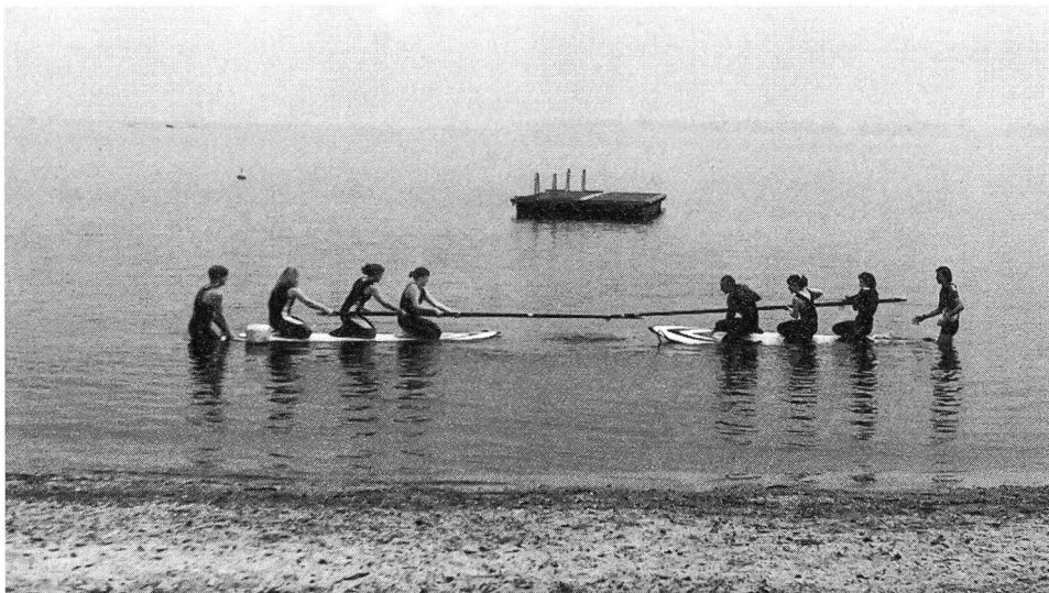
Jeux avec flotteurs et mâts...

L'après-midi était réservée aux Olympiades de Tenero, auxquelles ont parti-