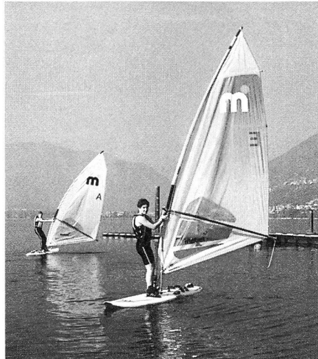
Rotation de 180° et départ.

n'était pas insurmontable et qu'elle n'arrivait pas à séparer les jeunes, mais que chacun devait y mettre du sien pour qu'il en soit ainsi.