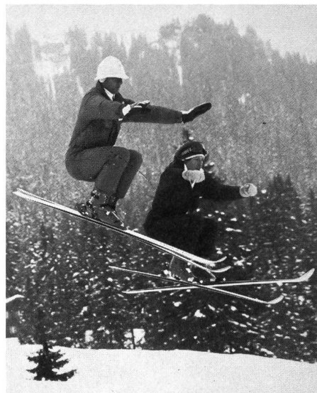
Sauts: attention à la chute.

Il ressort des explications qui précèdent qu'un «aîné averti en vaut deux», et qu'il fera donc bien, en d'autres termes, de prendre bonne note des recommandations suivantes: