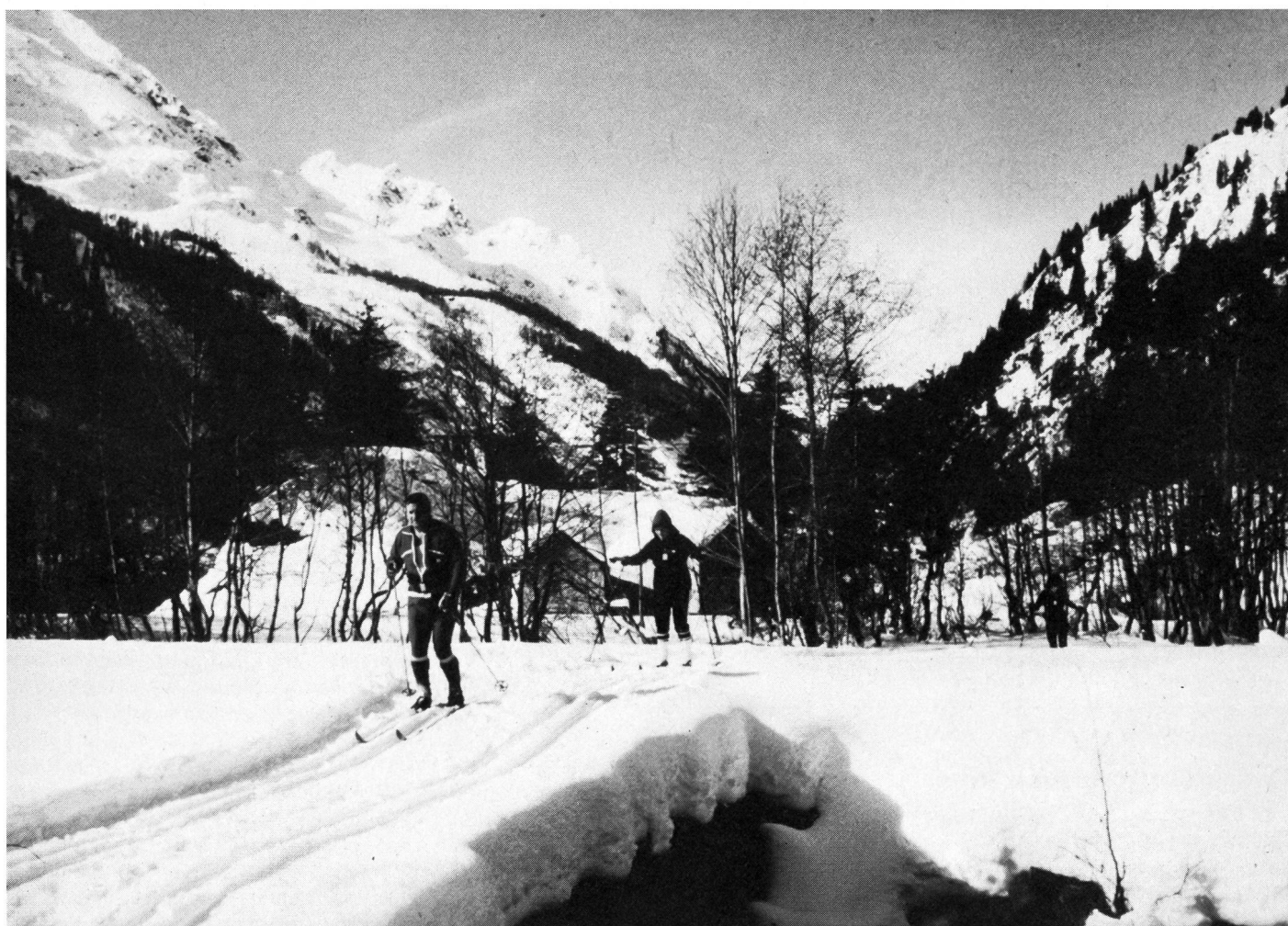
Le ski de fond, un sport pour tous les âges.

dans le plaisir, seul(e) ou en groupe, une partie de leur temps libre. De fait, les risques d'accidents qui menacent les personnes d'un certain âge, hommes ou femmes, ne sont pas plus grands à skis qu'au ménage ou dans la rue, pour autant que le comportement reste adapté aux conditions extérieures, pour autant, aussi, que l'équilibre entre la maîtrise technique et la capacité de performance individuelles reste assuré. ■