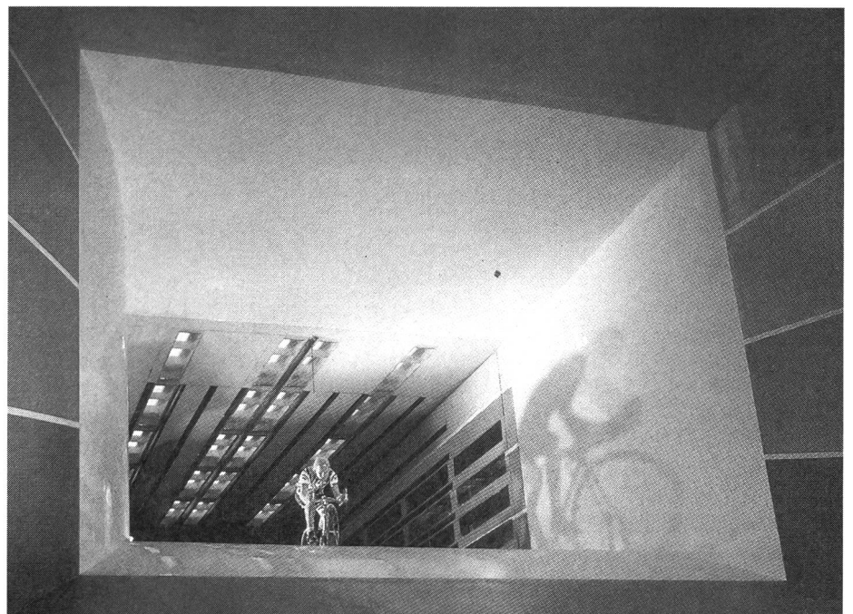
Simulation en soufflerie – Bernard Hinault, 1986. (Tiré du prix du mois)