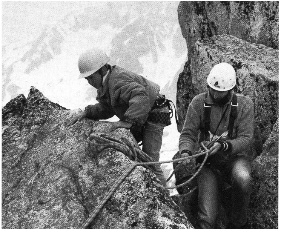
Le bon assurage ne supprime pas la responsabilité du moniteur.

Au cours de la discussion finale, les participants ont souligné l'utilité de ce séminaire; ils ont exprimé le vœu de participer périodiquement à de tels échanges de vues. Le groupe de travail a adressé ses remerciements au CAS pour son généreux soutien financier, de même qu'aux autres organismes dont il a salué la collaboration. ■