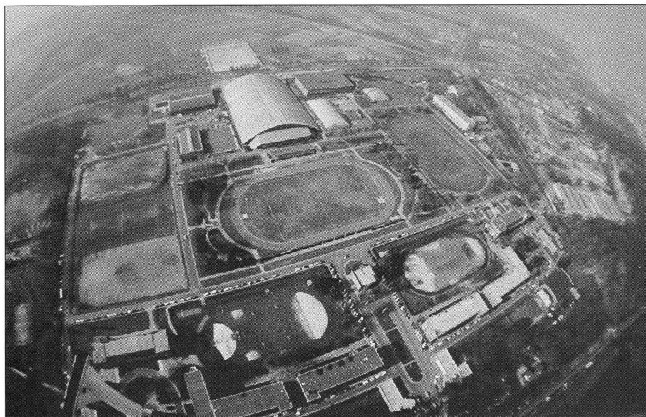
Vue plongeante sur les installations de l'INSEP.