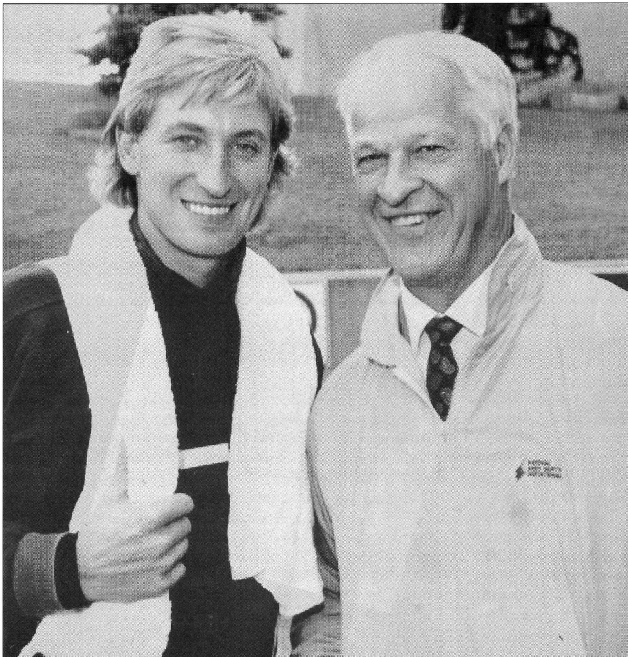
Le Canadien Wayne Gretzky (à g.): l'intelligence au hockey.

Dans une conception plus moderne du sport, les dirigeants nord-améri-