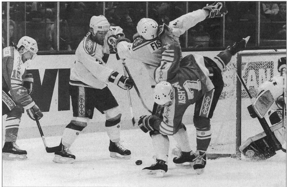
Canada-RFA: deux pays, deux continents, deux stratégies, une même vie.

rieur en utilisant les fondements actuels du jeu qui permettent et favorisent l'intervention physique (mise en échec) et mentale (intimidation) sur l'adversaire. Pour avoir vécu dès sa naissance en présence de cette constante contradiction, le hockey a aujourd'hui débordé de l'autre côté de la limite. Celle où le respect de l'être humain n'existe plus et où les vertus essentielles de la dignité sont impitoyablement sacrifiées sur l'autel de la victoire, du spectacle, de la compétition et de l'argent.