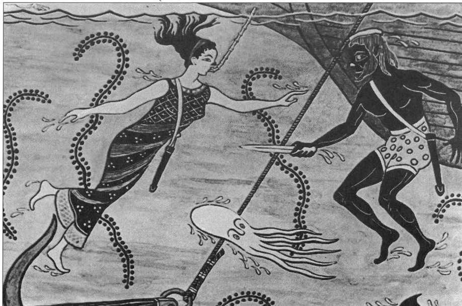
Avec ou sans palmes, la plongée a toujours eu un goût de légende.

Mais il n'y a pas que notre culture qui puisse compter de grands «apnéistes». Les membres de tribus des îles Salomon plongent depuis des millénaires. On a retrouvé d'étranges petites lunettes de plongée, creusées à même le bois. Comme le verre était totalement inconnu à cette époque (il y a 3000 ans au moins), les hublots des lunettes étaient faits d'écailles de tortue fine-