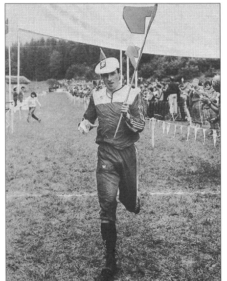
Tiré du «prix du mois».