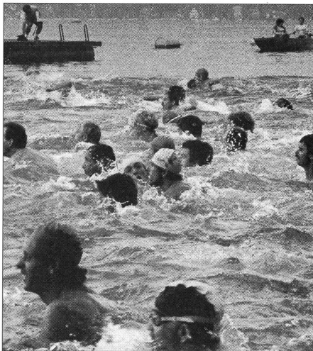
Sur le plan physiologique, la natation serait mieux placée en conclusion du triathlon.

Il n'est pas facile de définir clairement ce type d'individus en faisant la somme de leurs particularités. Pour mieux cerner leur personnalité, on peut partir de l'idée qu'ils ne sont pas assez sollicités dans le cadre de leur travail ou qu'ils le sont trop. On peut notamment supposer que, en réaction à l'ennui qui les accable au travail, ils visent en premier lieu à restaurer leurs facultés cognitives, psychiques et physiques, ainsi qu'à retrouver leur équilibre. Ainsi, pour les athlètes de ce type, les loisirs constituent avant tout un moyen de se remettre au travail; nous les avons donc qualifiés de «régénérateurs».