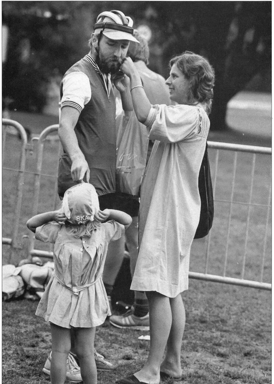
Juste le temps de changer de tenue et d'attitude dans sa tête: toute aide, physique et affective est utile à cet exercice.

Ainsi, on peut définir les individus de cette première catégorie par la faible