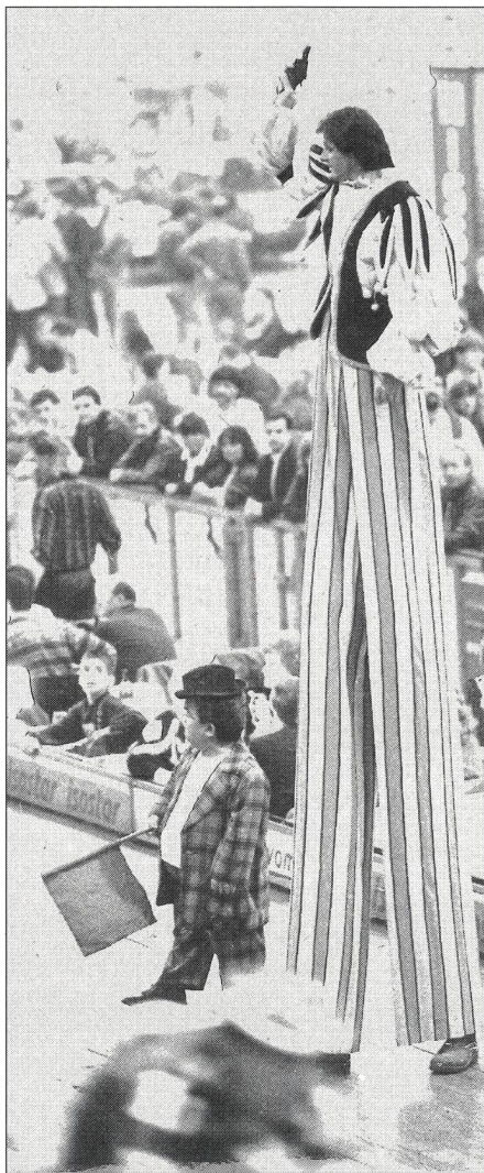
Le sport est beau, le sport est bon, le sport est sain, mais il peut être aussi tout le contraire! Tragi-comédie...