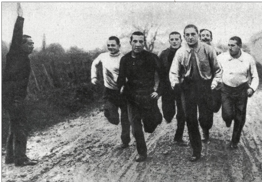
Jean Bouin et Georges Carpentier ou de la culture physique au spectacle.

Mais devant ce genre de piège, la littérature sportive joue aussi un rôle de mise en garde. C'est le cas du roman d'Alain Sergent Le Pain et les jeux , dont le titre révèle assez la position critique de l'auteur. Il nous montre un personnage obnubilé par «sa» boxe, tandis que sévit la crise économique et sociale et que se prépare la guerre. Le frère du boxeur envie secrètement son insouciance: Les menaces continues, ces histoires de politique, qui sentaient mauvais, enfin, oui ou non, était-ce normal? /.../ Il regarda Claude qui mangeait un sablé, rayonnant, tranquille, ah! si tranquille. Au moins, il ne se compliquait pas l'existence 6 . Roger Vailland est plus explicite, quand il met dans la bouche du vieux père Busard ce jugement: Les sports détournent la jeunesse des problèmes vraiment importants 7 .