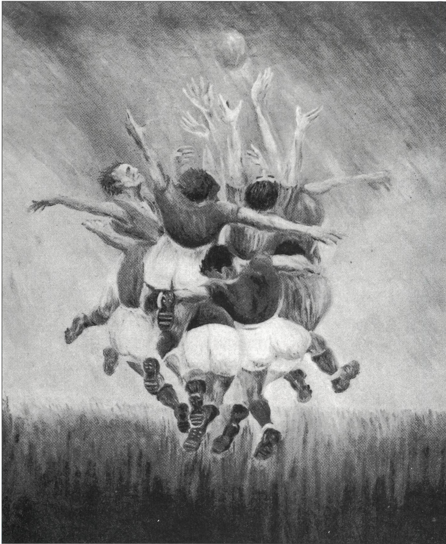
La «gym» balayée par la fascination du rugby.

le sport pour meubler la journée? Il offre d'abord des spectacles sains, récréatifs et vivifiants, puis de roboratifs sujets de lectures et de réflexion, de passionnants motifs de discussion... La plume acérée de Marcel Aymé esquisse une image de ce monde paradisiaque où la léthargie sociale et politique sera entretenue par des doses massives de lénitif à base de sport.