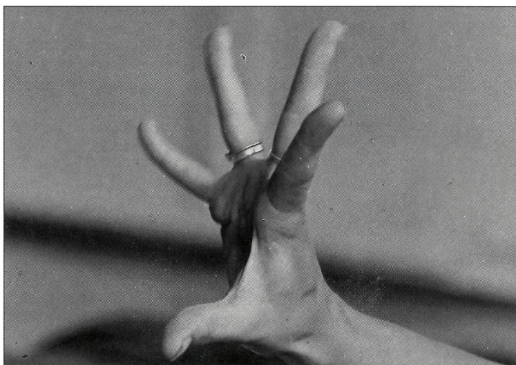
La main, objet de dialogue.

Je pense qu'il est intéressant de présenter, maintenant, un développement, tout en signalant qu'il n'est ni exhaustif, ni unique (un thème peut toujours être repris, tant les possibilités de son déroulement varient). Il s'est déroulé sur 12 heures environ, avec un groupe d'élèves avancés.