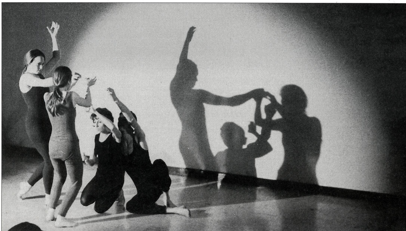
Mouvement et expression...

Ceci m'entraîne à considérer l'élève dans sa globalité, c'est-à-dire à tenir compte des divers aspects de sa personnalité. On est loin des mouvements imposés et d'une exigence unifiée.