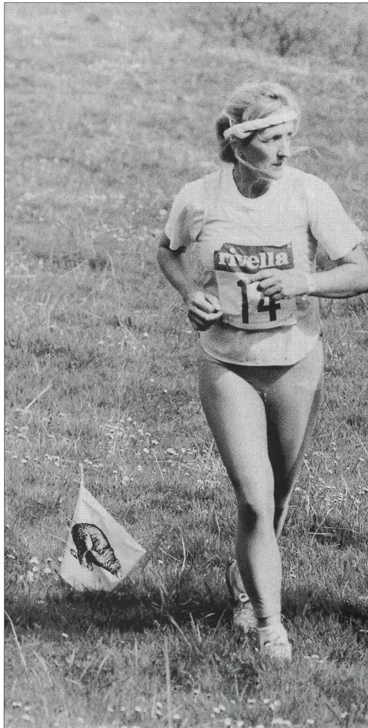
Que crois-tu: est-ce vraiment bon pour la santé?

Dans notre monde pétri de règles et de normes propres à assurer la sécurité, prendre des risques devient difficile. Ainsi, les jeunes, tentés par l'aventure, s'écartent bien souvent du droit chemin, que ce soit au volant – ils mettent alors aussi les autres en danger – ou en transgressant diverses interdictions; par là même, ils nuisent à eux-mêmes et à leur environnement (du moins sur le plan matériel). Le sport, lui, permet de prendre des risques calculés dont on peut assumer la responsabilité.