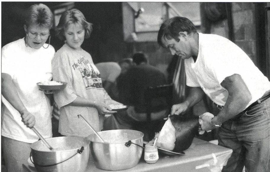
La montagne, ça creuse, et sans un estomac bien garni, la petite troupe aurait bien vite perdu les traces de Souvorov.

Pour tous, les traits de Souvorov se sont dégagés lentement mais sûrement de la légende, dévoilant peu à peu un être humain fait de chair et de sang, un être finalement respecté, même si sa doctrine ne pouvait être autre que celle d'un soldat en campagne: tuer ou être tué! Le souvenir du prince généralissime Aleksandr Vassilievitch Souvorov, disparu une année après sa traversée des Alpes, est resté très vivant au sein de la population. Il ressurgit d'ailleurs presque à chaque pas: ici par le biais d'un monument élevé en son honneur, là par celui de plaques commémoratives et d'inscriptions diverses. Enfin, il ne faudrait pas oublier le petit musée