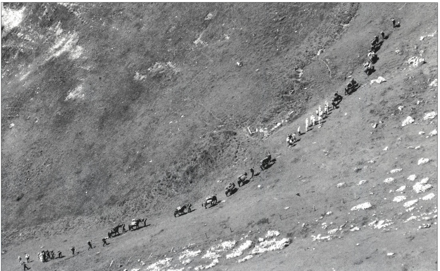
L'«accompagnement» logistique à l'assaut du col du Kinzig.

nons. Au sommet du Panixer, qui débouche, à 2400 m d'altitude, en pays grison, la couche dépassait largement le demi-mètre. Sans combattre, Souvorov y aurait perdu la plus grande partie de ses bêtes de somme et de ses chevaux, de même que plus de 200 soldats, victimes du froid ou de chutes fatales.