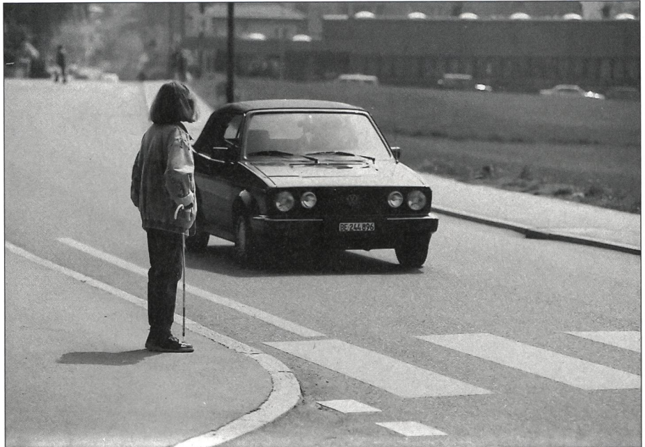
Une concentration maximale et l'art de différencier les bruits permettent à l'aveugle de s'orienter dans la circulation.

Prenons un exemple: un maître d'orientation et de mobilité fait entendre à un élève des bruits qui proviennent de plusieurs directions et qu'il doit différencier les uns des autres. Pour se rendre compte de ce que requiert une telle performance, il suffit d'aller à un croisement très fréquenté et de fermer un instant les yeux (comme piéton, bien sûr) en essayant de distinguer les bruits importants - c'est-à-dire ceux qui pourraient présenter un danger - des autres. A la seule idée de devoir tra-