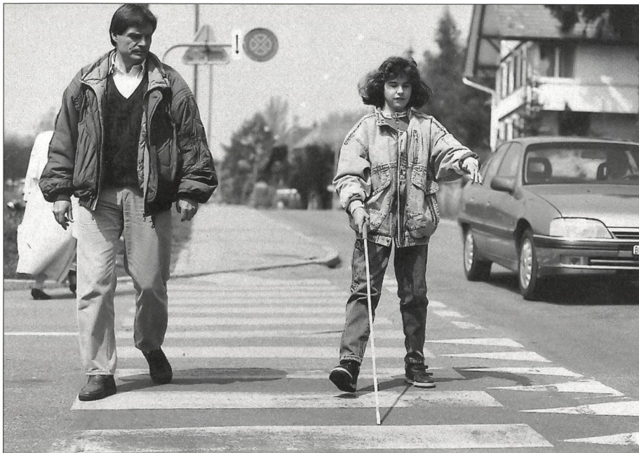
A mesure que l'élève acquiert de l'expérience et de la confiance en soi, la présence du maître se fait plus discrète.

leur des feux de signalisation, et en l'intégrant dans ses considérations, l'aveugle peut franchir un croisement de manière sûre et fluide.