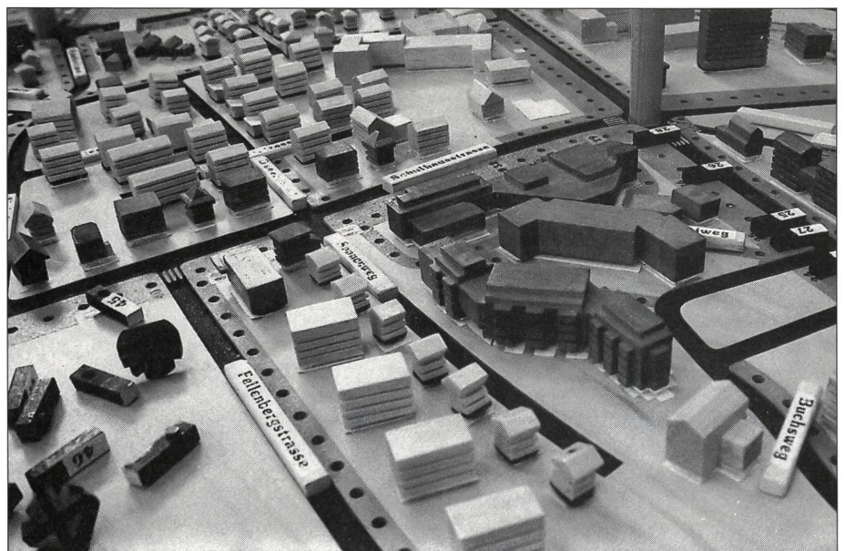
En jouant, on mémorise le chemin de l'école, du centre d'achat, de la poste, etc.