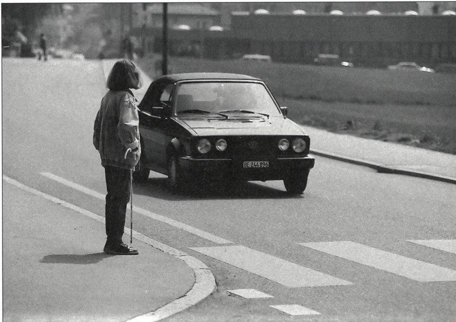
Une concentration maximale et l'art de différencier les bruits permettent à l'aveugle de s'orienter dans la circulation.

Prenons un exemple: un maître d'orientation et de mobilité fait entendre à un élève des bruits qui proviennent de plusieurs directions et qu'il doit différencier les uns des autres. Pour se rendre compte de ce que requiert une telle performance, il suffit d'aller à un croisement très fréquenté et de fermer un instant les yeux (comme piéton, bien sûr) en essayant de distinguer les bruits importants - c'est-à-dire ceux qui pourraient présenter un danger - des autres. A la seule idée de devoir tra-