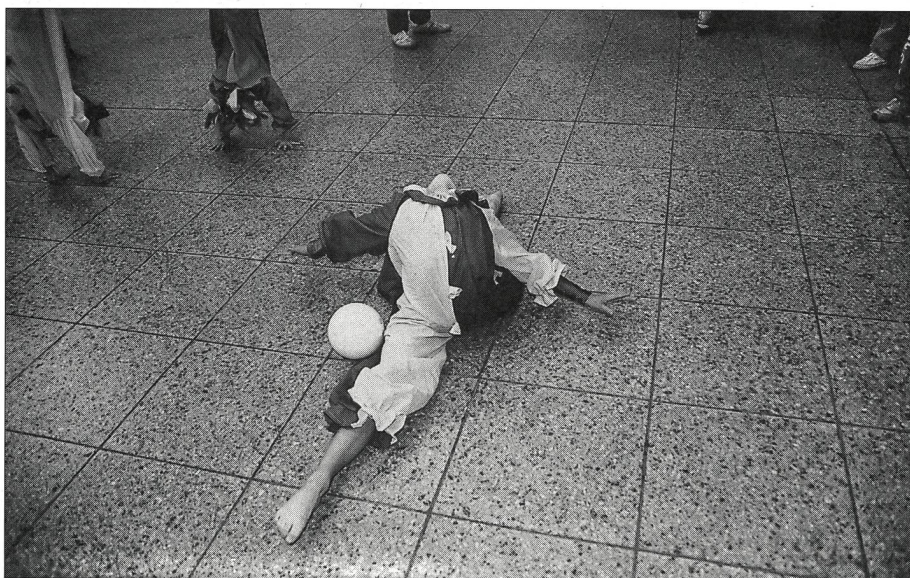
La Grande-Bretagne fait sa «publicité».

Si nous n'avons pas parlé de l'organisation de la Gymnaestrada, c'est parce qu'elle fut parfaite en tout point. Comme cela se passe en tel cas, le travail dantesque accompli par les responsables hollandais passa inaperçu. Ils méritent d'autant plus notre reconnaissance. Grâce à eux, nous avons passé une semaine extraordinaire et nous ne sommes pas prêts d'oublier les souvenirs que nous avons accumulés!... ■