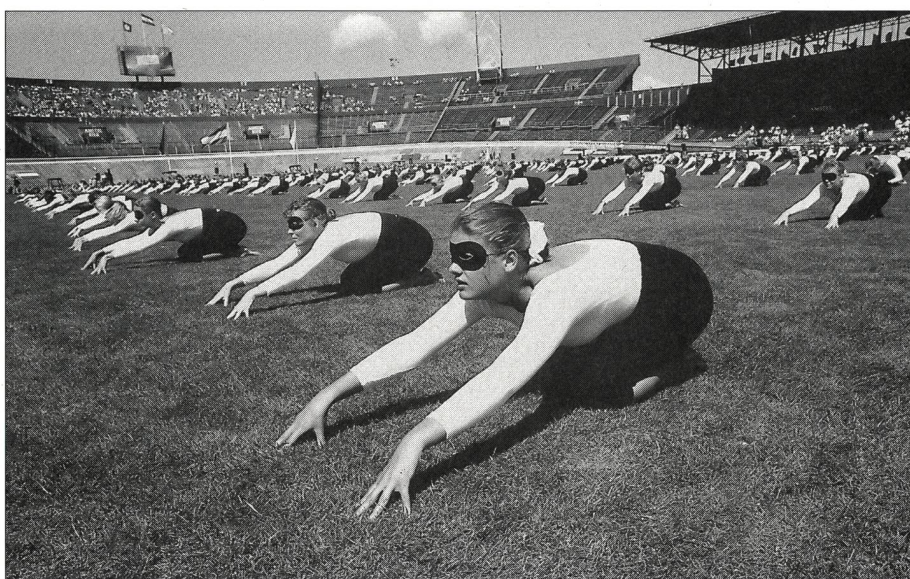
La Hollande, féline.