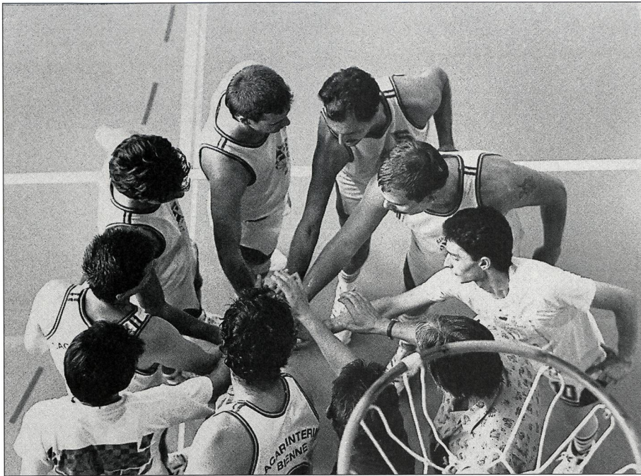
Le «Moi» au service du «Nous»!

(chacun marche 1 minute). Autour de chaque marcheur, les équipiers lancent des noms d'animaux pour le décrire. Lorsque tout le monde a passé, chacun dit les noms d'animaux qui lui ont plu et pourquoi. De même, ceux qui ne lui ont pas plu et pourquoi.