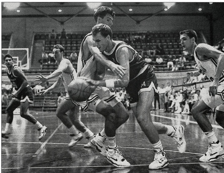
Le joueur au centre des préoccupations!