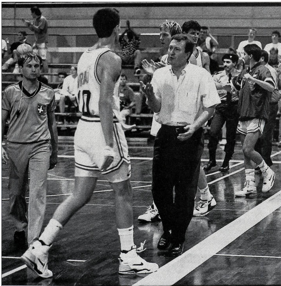
Corriger, à l'aide de consignes claires et positives!

Exercice 3: «Comment les autres me voient?» Un à un, faire marcher chacun au milieu du groupe disposé en cercle