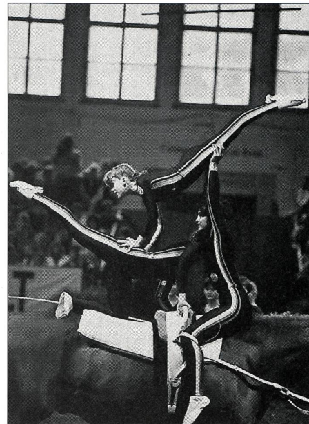
Le «libre» des Suissesses.