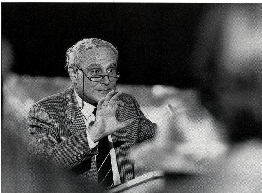
Flavio Cotti, ministre suisse de la culture et... du sport!

Désireux de ne pas trop disperser mon propos, je laisserai de côté le sport-spectacle, qui avait déjà depuis longtemps donné lieu à des diatribes de la part d'écrivains comme Georges Duhamel ou Jean Giono 2 . Je ne parlerai pas ici du spectateur, qu'un Georges Hébert voulait chasser du stade, car je suis soucieux de centrer cette réflexion sur les incidences culturelles du sport au point de vue du pratiquant, modeste ou de haut niveau.