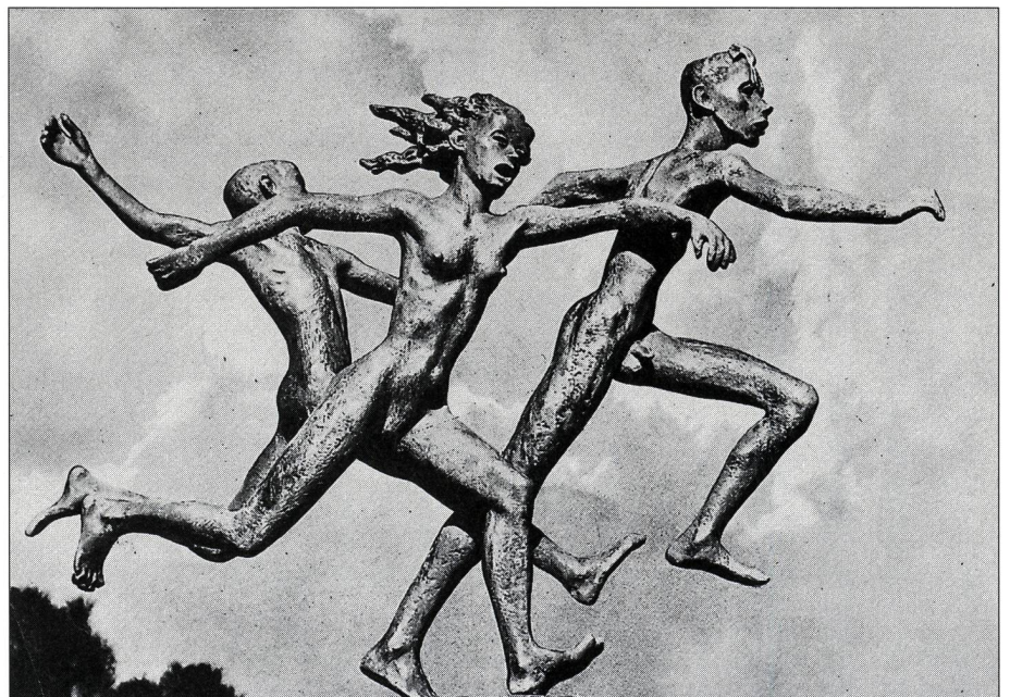
... entre ma foulée, sa cadence et un mouvement dansé.

Ainsi lignes, couleurs, volumes, timbres, sonorités, rythmes, cadences, font-ils partie du sport comme ils sont les éléments de base de la création 6 ».