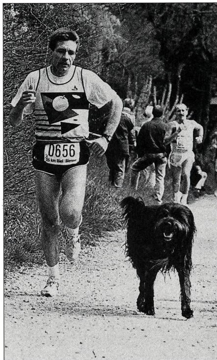
Tout au fond, peu apparent mais bien réel: le plaisir!

Je me ferai ici l'écho d'un éditorial qu'Yves Jeannotat a récemment écrit pour MACOLIN 11 , où il dénonçait la condition du champion, devenu, disait-il, «l'esclave type des temps modernes». Au fond, une telle dénonciation