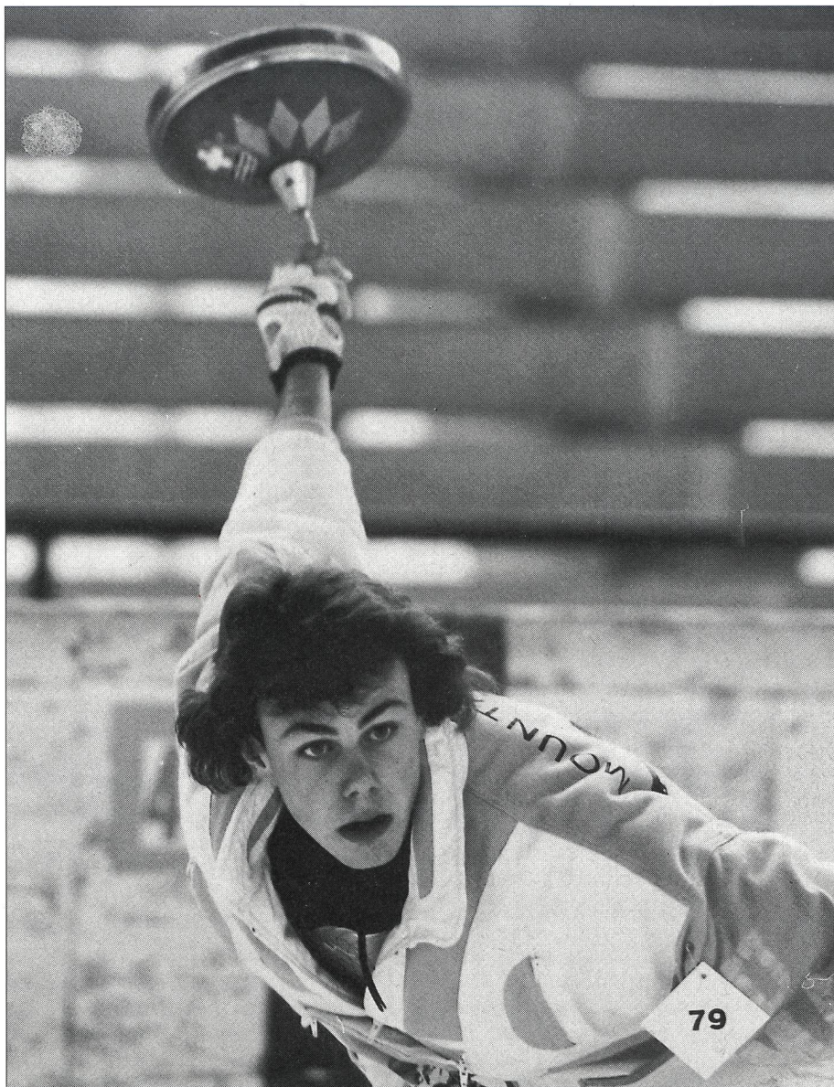
Un geste élégant et efficace.

Pour le calcul des points, c'est le nombre de crosses d'une même équipe se trouvant le plus près de la «daube», par rapport à celles de l'équipe adverse, qui est déterminant. Un jeu se compose de six manches. Dans chaque manche, chaque joueur n'a droit qu'à un seul tir. L'équipe qui remporte le jeu est celle qui a obtenu le plus grand nombre de crosses placées après les six manches. Elle reçoit alors 2 points. Si les deux équipes ont le même nombre de crosses placées, chacune reçoit un point. Seuls les deux chefs d'équipe ont le droit d'entrer dans la surface d'arrivée, pour mesurer la distance entre la «daube» et les différentes crosses.