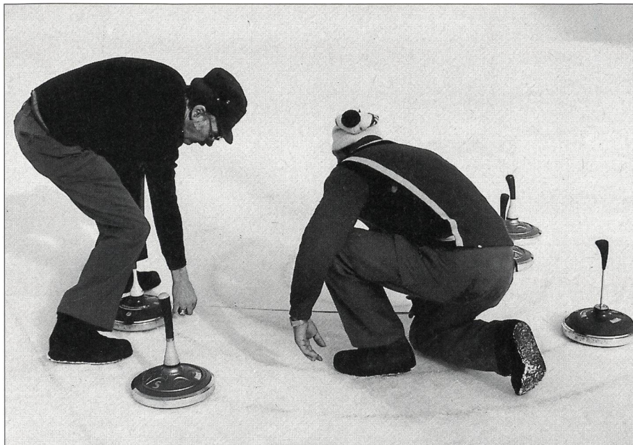
Comme à la pétanque: au centimètre près!