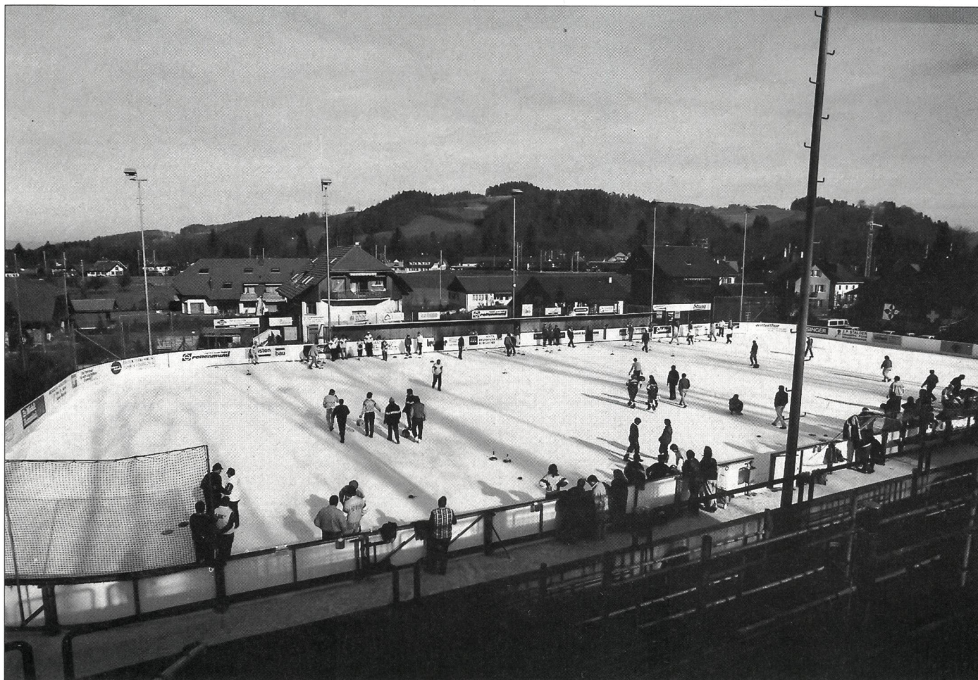
Une place au soleil à Hasle-Rüegsau (Emmental) pour la «cross sur glace».

L'origine de ce sport remonte vraisemblablement à la fin du XVI e siècle: en hiver, quelque part dans le Steiermark, des valets de ferme ont eu l'idée de lancer leur chaise à traire sur la surface gelée d'un étang pour voir qui la ferait glisser le plus loin. Le sport de la «crosse sur glace» était né. Des historiens ont toutefois trouvé que, dans l'ancienne Ratisbona (Ratisbonne), des légionnaires romains avaient déjà pratiqué un sport semblable et que la «crosse sur glace» semblait également connue des Scandinaves au XII e siècle.