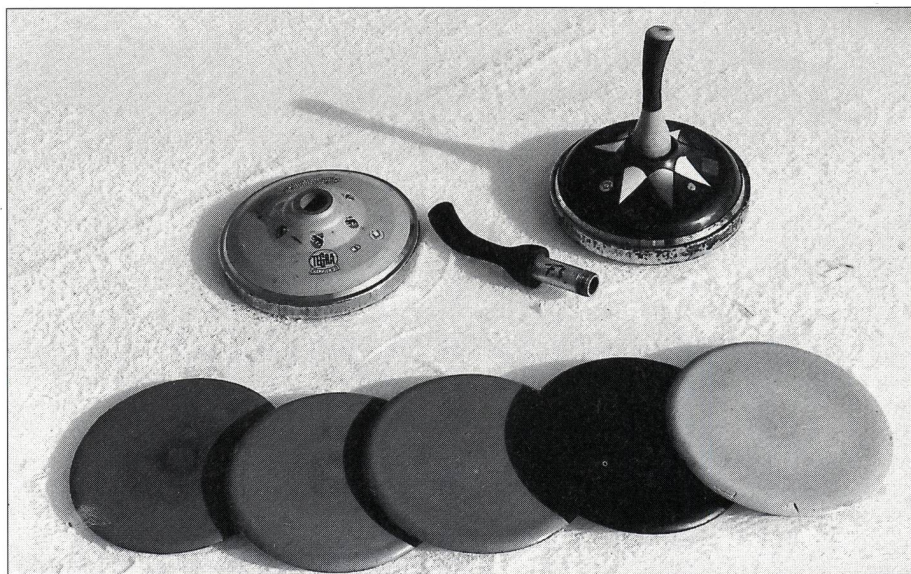
Matériel parfaitement réglementé et standardisé.