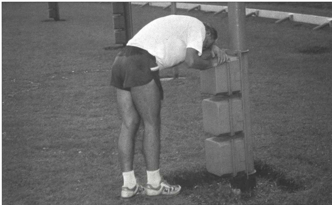
Près de 40 pour cent des coureurs de longues distances souffrent de douleurs stomacales et intestinales. Pourquoi?