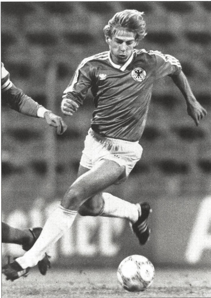
Le football exige davantage que de la vélocité et de l'endurance. Pour bien jouer, les critères décisifs sont un sens aigu de l'orientation dans l'espace, une bonne coordination psychomotrice et un bon équilibre. Ce sont donc ces éléments qu'il convient de travailler en priorité.

Des études menées sur quelques couples de jumeaux ont mis en lumière que le patrimoine héréditaire jouait également un rôle de premier plan à côté des «prédispositions de l'enfance». La recherche sportive a montré, par exemple, que les muscles peuvent être «rapides» ou «lents» et «endurants». L'enfant qui possède de nombreuses fibres musculaires «rapides» est un sprinter né et devancera ses camarades, même sans entraînement. La même chose vaut pour le type endurant. Ces découvertes ont amené à rechercher des méthodes et des tests d'évaluation des qualités du