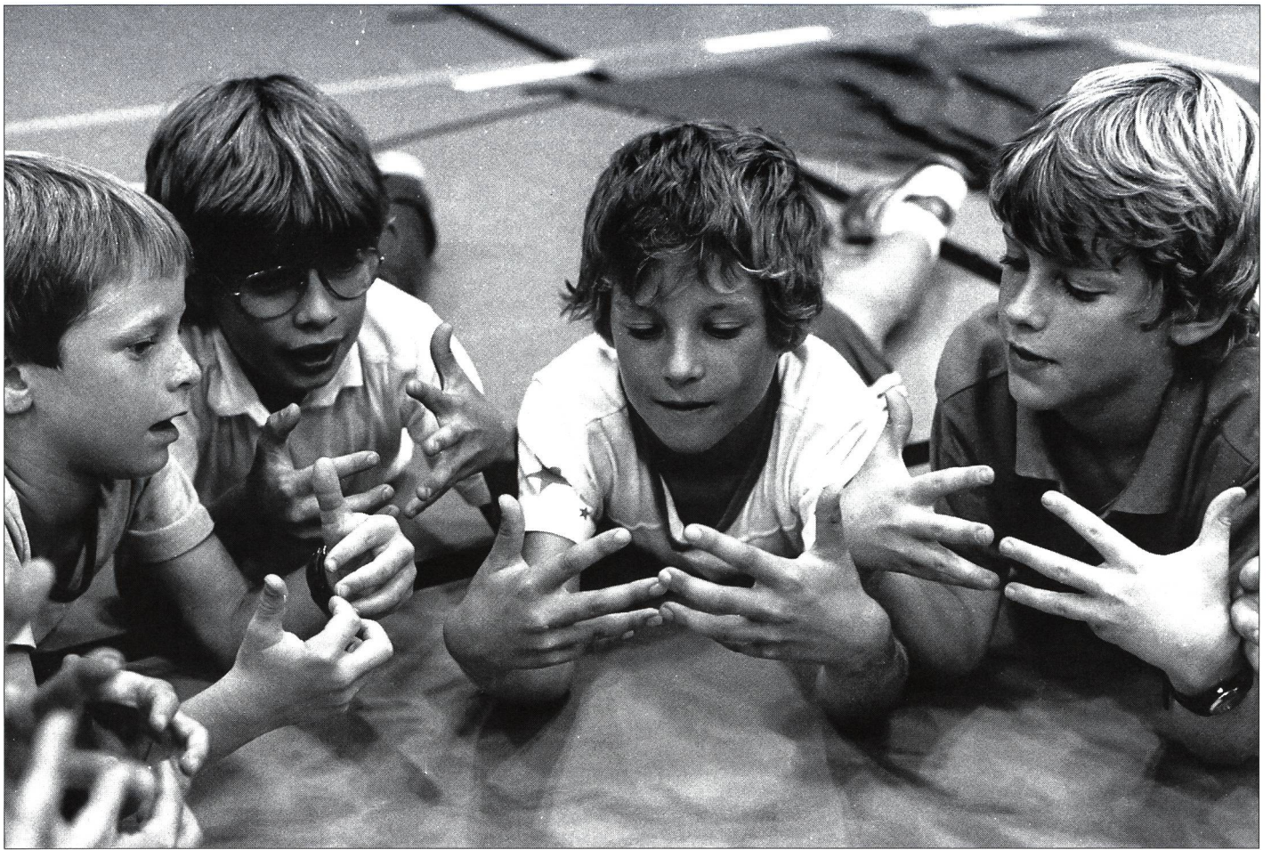
Jeunesse + Sport dès 10 ans? Pour demain peut-être...