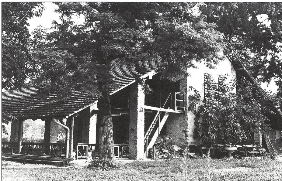
Camping Cascina: la cuisine de campagne.

Quant aux diverses activités communes: repas pris au bâtiment central, vie au