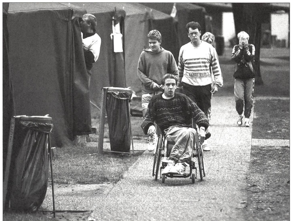
Les handicapés ont aussi droit de cité à Tenero.

Les conditions météorologiques enregistrées lors du séjour au CST sont donc très importantes pour garantir la réussite d'un cours. L'offre d'infrastructures cou-