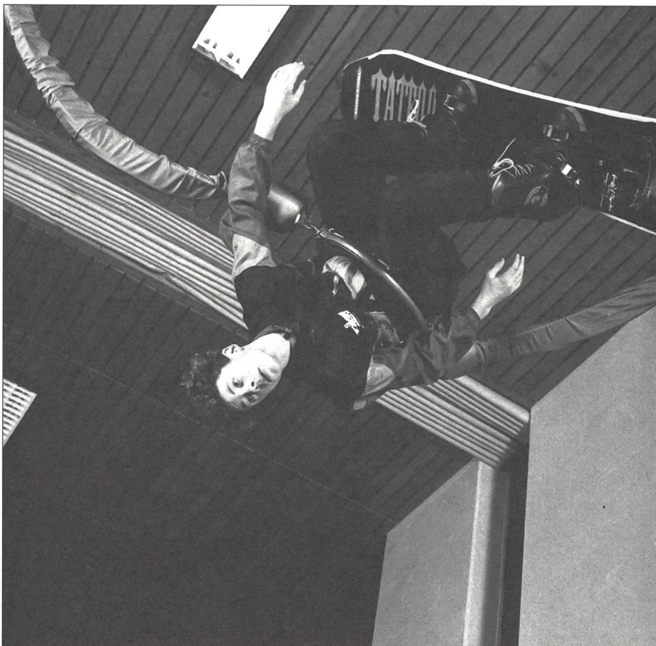
Les spécialistes du snowboard y trouvent aussi leur compte.