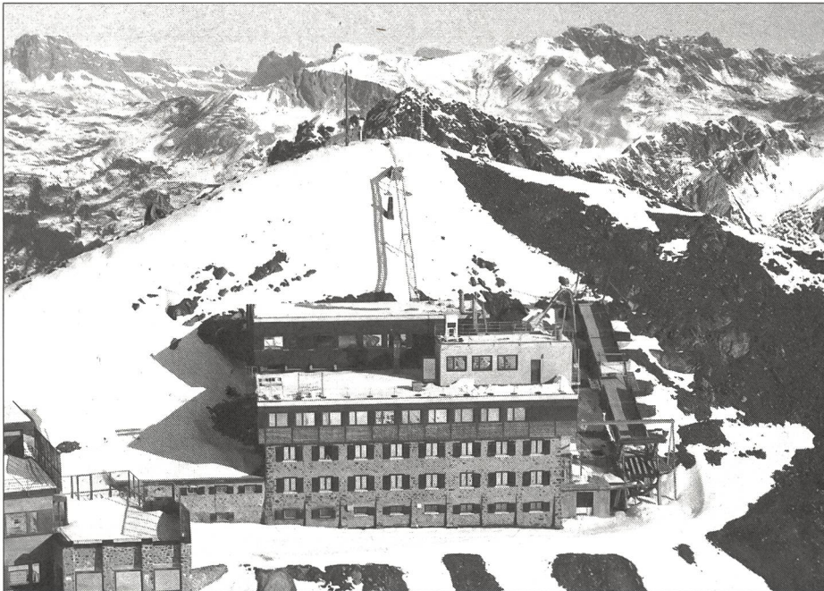
L'Institut de Weissfluhjoch/Davos à 2670 m d'altitude.

Quels sont les mobiles de cette harmonisation? Y a-t-il des modifications importantes? De quels moyens dispose-t-on dans le domaine de la prévention des avalanches? Le présent article vise à répondre brièvement à ces questions.