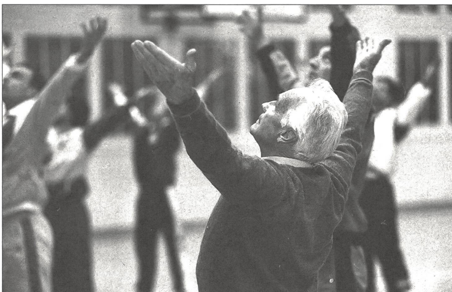
L'alternance entre tension et détente n'est plus garantie à notre époque.

Toutefois, l'importance du sport pour la relaxation au sens strict, c'est-à-dire comprise comme récupération en profondeur, réside dans la phase de récupération après l'activité sportive , l'effort physique entraînant un renforcement de l'activité du parasymphatique lors de la phase trophotrope. Certains types d'activité sportive, vus sous cet angle, sont particulièrement intéressants (Meusel 1992). Les expériences réalisées ont en