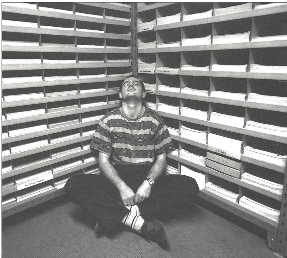
Relaxation programmée à l'heure de la pause?

Au début tout particulièrement, il est recommandé de disposer d'une salle calme et de mettre de habits confortables pour pouvoir exécuter ces exercices à l'aise et sans être dérangé. On est bien: on se couche, décontracté, on s'assied confortablement, coudes sur les cuisses