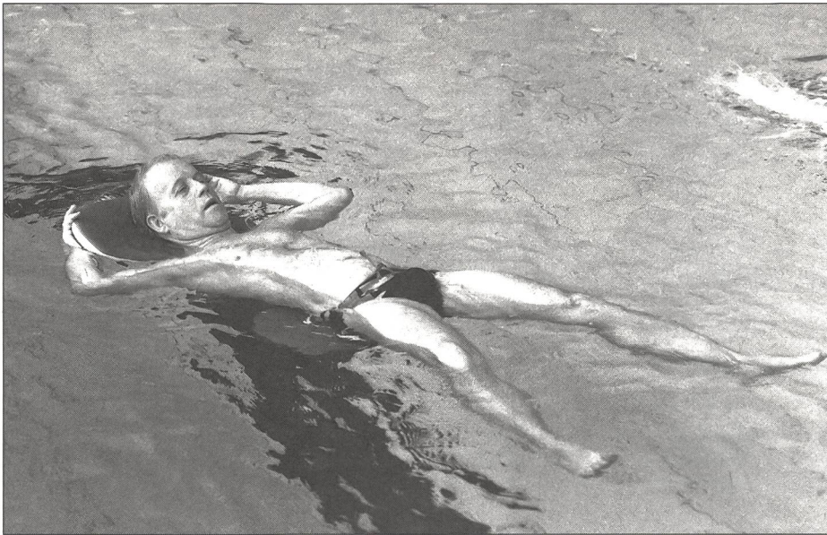
Détente bienfaisante dans l'eau.

effet mis en évidence qu'une activité sportive relativement prolongée, mettant à contribution de grands groupes de muscles à une intensité légère ou moyenne, favorisait une relaxation approfondie lors de la phase de récupération. Par conséquent, ce sont avant tout les sports d'endurance qui permettent au système neuro-végétatif de bien récupérer dans la phase trophotrope, à condition d'être pratiqués sans efforts exagérés: si le sujet ne transpire pas pendant l'effort, l'exercice est insuffisant; s'il dort mal après, l'effort aura été trop intense!