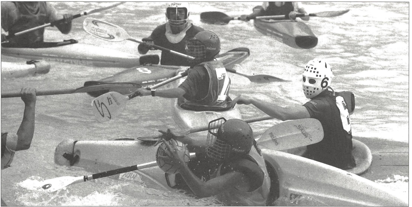
Les pagaies entrent dans la danse pour s'emparer du ballon ou repousser l'adversaire.

canoë-kayak sous toutes ses formes: les excursions en eau vive, les disciplines de compétition (slalom, régates, descente) et, également, le kayak-polo. Enfants et jeunes sont prêts à s'engager. Ils aiment se mesurer, adorent participer à des compétitions. Ballon et buts sont des éléments nouveaux en canoë-kayak. Le kayak-polo récompense de manière tangible l'engagement et la créativité des participants: sous la forme de buts!