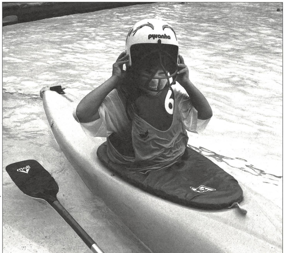
Coiffer le casque, la pagaie à portée de main: prêt à s'engager dans le jeu.

Selon la gravité de la faute commise, le joueur écoperait d'un avertissement (carton vert), de 2 minutes de pénalité (carton jaune) ou sera expulsé (carton rouge). Le jeu continue par un lancer indirect dans le premier cas, par un coup franc direct dans le second, ou, dans le dernier, par un tir au but exécuté à une distance de 6 m face au but sans défense.