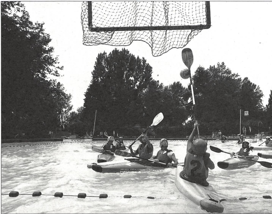
Non seulement les piscines, mais aussi les plans d'eau tranquilles tels que lacs, rivières calmes, petits étangs artificiels se prêtent à la pratique du kayak-polo.

gaie mais il est interdit de le frapper. De même, il n'est pas permis de transporter la balle dans sa jupette. Le joueur en possession du ballon doit le jouer dans les cinq secondes.