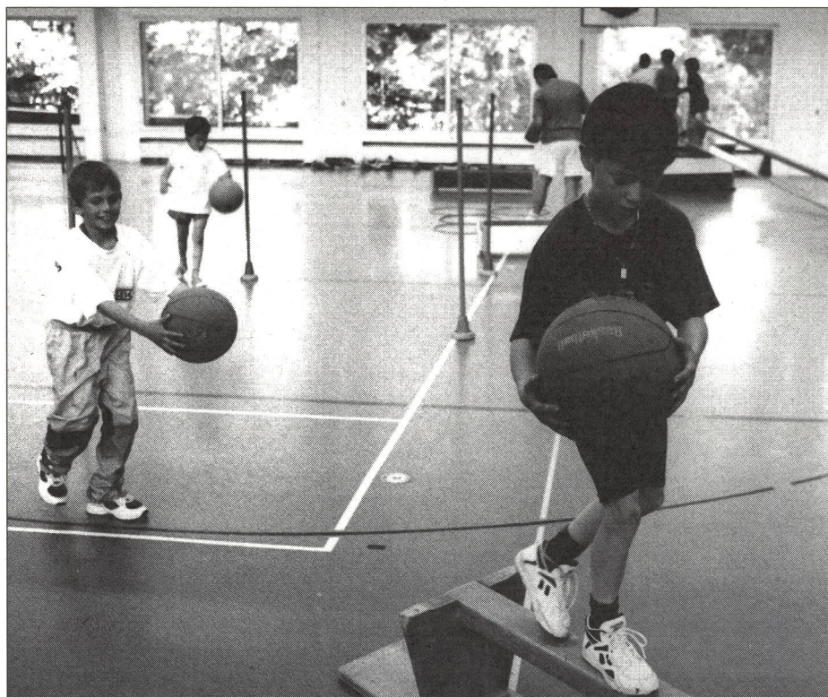
Celui qui maîtrise le maniement d'un ballon aura également moins de peine à manier la crosse et le puck sur la glace.

Pour ces différentes raisons, les entraîneurs du CP Langnau considèrent avec scepticisme cette nouvelle distribution des différentes classes d'âge. Comme tout bon entraîneur, ils se sont malgré tout déjà préparés à affronter les problèmes à venir. Ainsi, ils ont mis sur pied une nouvelle conception de la formation, conception applicable dès l'automne 1995. Elle évitera, dans la mesure du possible, d'entraver le développement des jeunes joueurs... ■