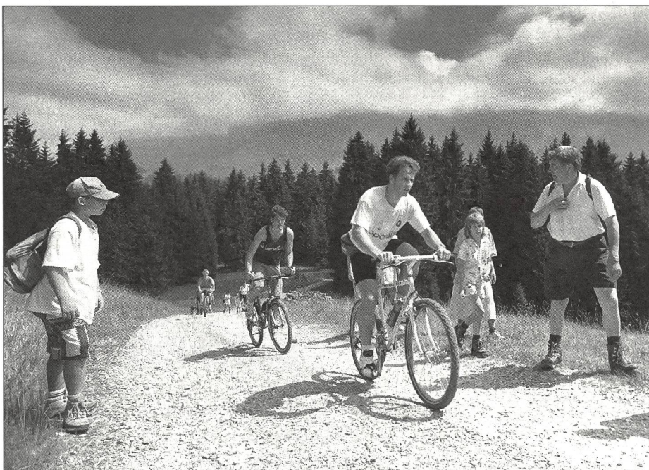
Sortie familiale en montagne: les parents, les frères et sœurs, les plus jeunes se déplacent en car et à pied, les juniors et la première équipe en VTT.

La formation dispensée ne vise pas des résultats immédiats mais s'inscrit dans une politique à long terme: il ne s'agit pas tant de fabriquer des champions en couches-culottes que de former des joueurs qui arriveront à leur pleine maturité dans 10 ou 12 ans. Il est extrêmement délicat de déterminer, aujourd'hui déjà, quelles sont les qualités dont devra faire montre le hockeyeur de la prochaine décennie. C'est pourquoi, l'entraîneur créatif ayant développé des visions d'avenir aura toujours l'occasion d'exercer ses talents.