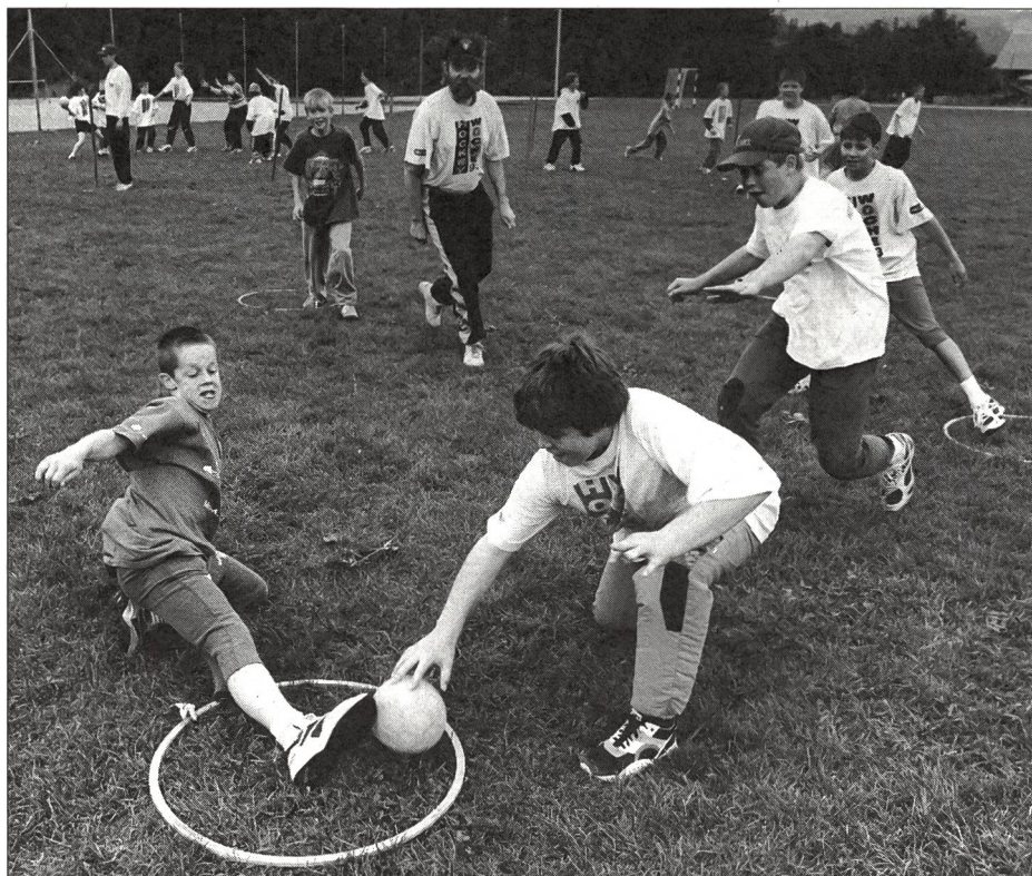
Après-midi de jeu: 2 heures de jeu en petits groupes.