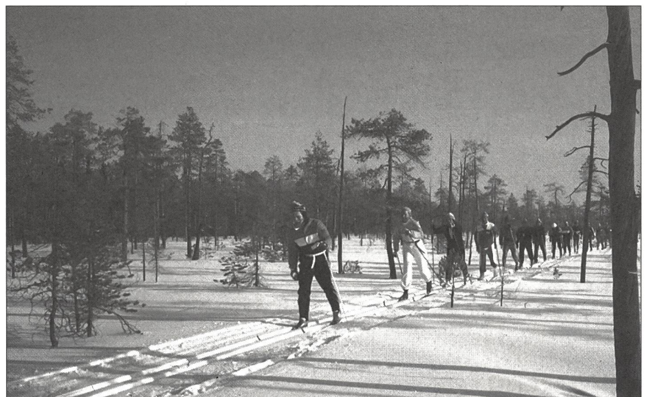
En groupe au cœur de la nature.

improvisés dans les salles de classe – matelas au sol au milieu des livres, tableaux et ordinateurs –, les participants n'auront pas manqué de faire un détour par la salle paroissiale, où il y a de nouveau bal ce soir. Le matin, dévorés par la curiosité, les élèves viennent surprendre les skieurs au saut du lit, avant que les salles soient rangées. Beaucoup viennent encore à l'école à skis de fond, mais une grande partie, progrès oblige, se déplace en scooter des neiges (coût: la moitié d'une voiture). Chaque école est équipée d'une piste de ski de fond éclairée et d'une patinoire pour jouer au hockey. Une vaste école d'été nous héberge pour la nuit qui précède la dernière étape. Il n'y a pas l'eau courante en hiver, mais le sauna fonctionne, et l'association féminine locale veille à nous assurer un copieux repas. La soirée de clôture se déroule au palace local, tandis que le bar du sauna nous offre notre premier ravitaillement après 70 km de course. Le banquet d'adieu et les festivités se poursuivent tard dans la nuit. D'ailleurs, les Finlandais ne sont-ils jamais fatigués?