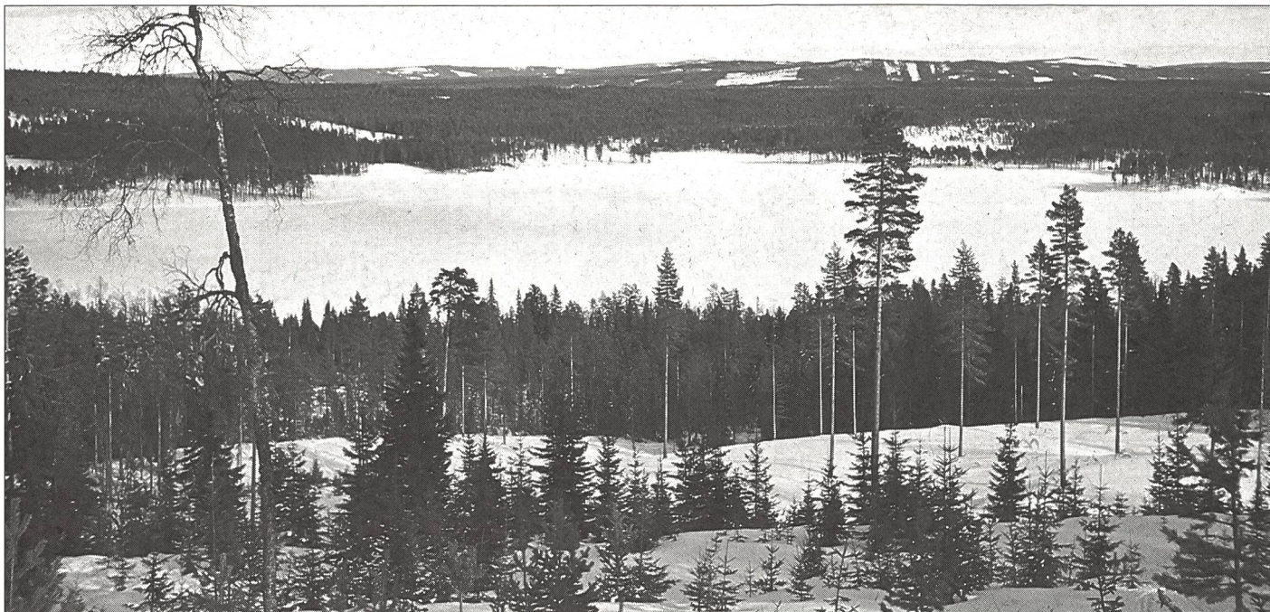
L'infini des paysages enneigés.