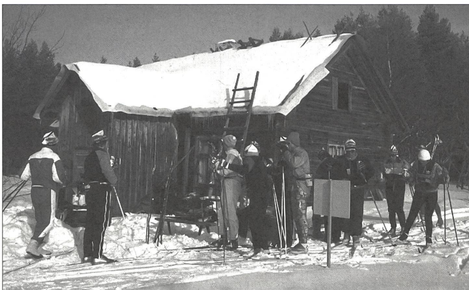
Au poste de ravitaillement, l'occasion d'une brève rencontre.

Des postes de ravitaillement sont implantés sur la piste environ tous les 12 à 15 km: une fois ce sera une voiture parkée, coffre ouvert, à un carrefour ou au bord d'une route, une autre fois une cabane perdue au milieu de la forêt et accessible uniquement en motoneige, ou encore le salon d'une ferme isolée, une école ou le coin pique-nique d'une station-service. Le menu varie peu: jus de fruit plus ou moins chaud, dilué, sucré, quartiers d'orange, concombres salés, raisins secs, de temps en temps des canapés, des bananes et des barres de cho-