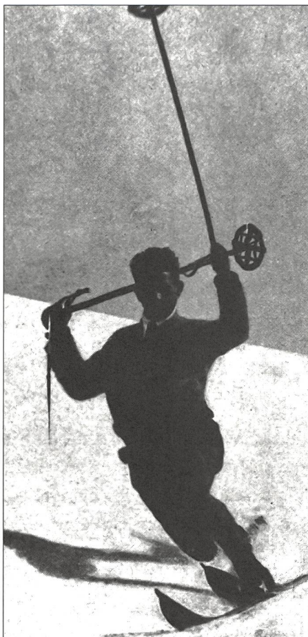
Virage en télémark, bâtons levés (selon Dahinden).

Les considérations émises par Dahinden sur l'apprentissage du programme – même s'il n'a jamais utilisé ce terme – avaient quelque chose de révolutionnaire. Il a en effet découvert très tôt qu'apprendre à skier, c'était d'abord acquérir la maîtrise d'une sorte de programme de base qu'il s'agissait volontairement ou impérativement d'adapter, dans sa forme extérieure – on parlerait, aujourd'hui, de composante variable – aux exigences momentanées du terrain: Celui qui s'applique à progresser ne doit donc plus, comme cela se fait traditionnellement, apprendre une multitude de formes de mouvement différentes, de courbes et de virages; il lui suffit, au contraire, de convertir et d'appliquer au ski comme il se doit un seul mouvement élémentaire: celui de la marche. A ajouter à cela cette indication évidente qui devrait, aujourd'hui encore, servir de critère de discussion méthodologique: Il est inutile de réapprendre, il faut apprendre en plus! Ce que le débutant assimile à la base