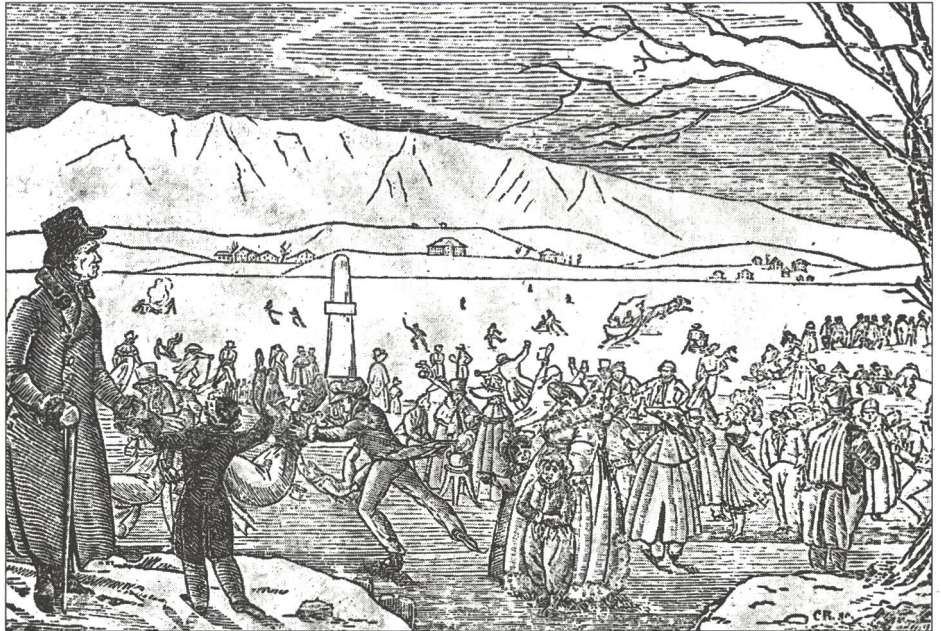
Joyeux ébats sur le lac gelé. Zurich, hiver 1829/30.

L'auteur du premier traité français de patinage est J. Garcin, qui publia en 1813 «Le vrai patineur ou les principes sur l'art