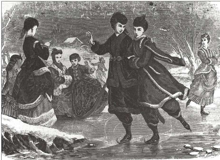
Gracieuses évolutions de patineuses. USA, hiver 1869.

Il est assez surprenant de constater qu'en ce siècle où le progrès technique et la motorisation connaissent un essor sans pareil, les hommes se soient souvenus des modes de locomotion les plus anciens et se soient tournés, pour leur plaisir hivernal, vers la luge, le ski et le patin.