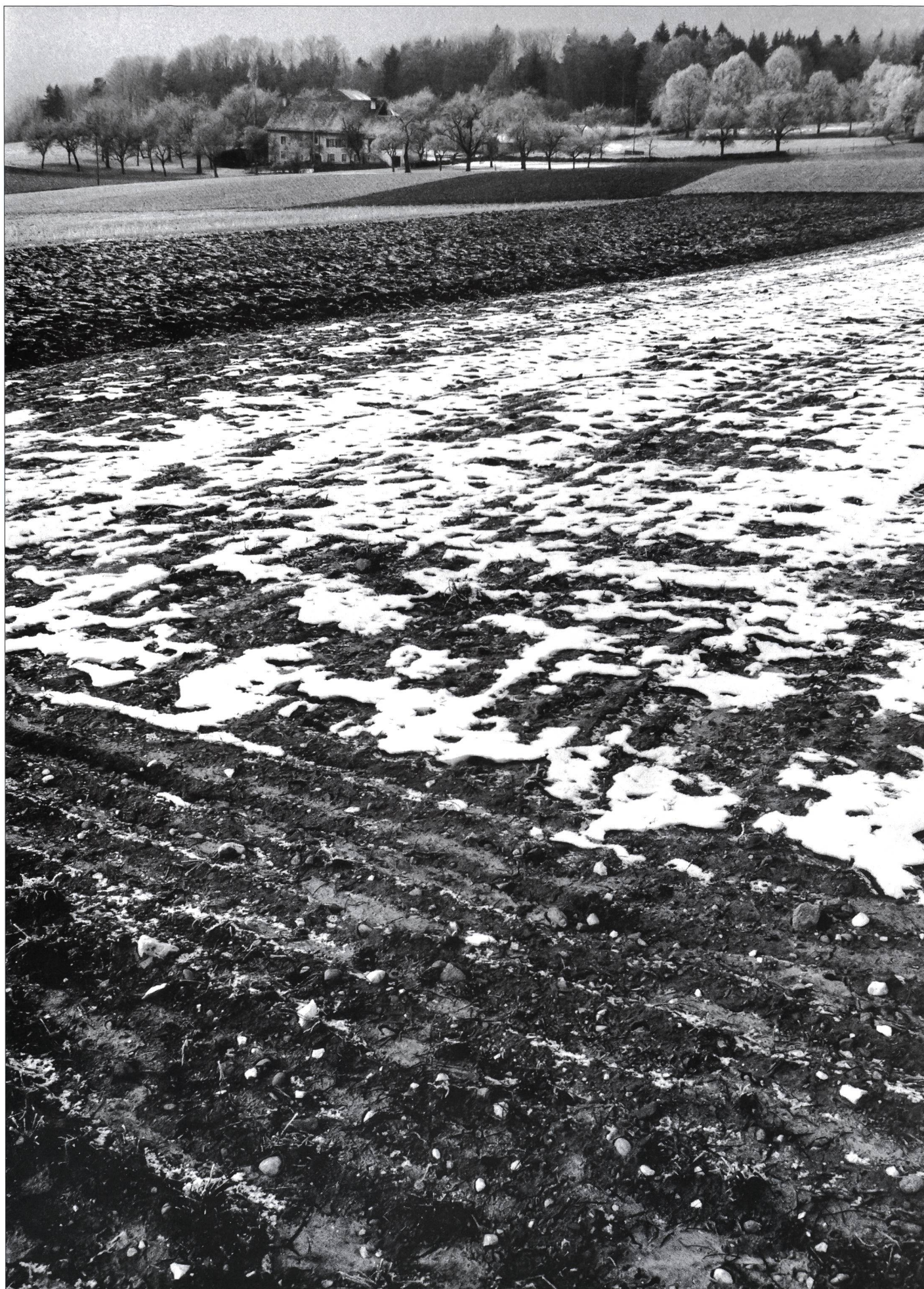
Ferme de la «Gruebmann».