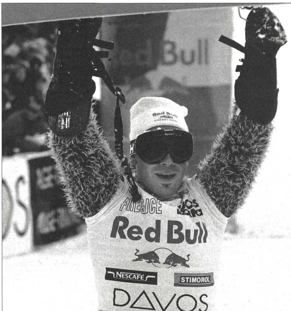
Martin Freinademetz (A), champion du monde aux slaloms géant et parallèle.

Q ui se cache derrière le «sauvage» fonçant sur sa planche? L'amatour de techno à l'allure débraillée qui, sous l'effet de l'alcool, de la nicotine, d'une boisson autrichienne ou de l'«Ecstasy» s'éclate dans les discos? L'ennemi juré du skieur bien élevé, agressif et effronté, la casquette à l'envers et affublé d'un pantalon trop large? Un inconscient cherchant à concurrencer des athlètes sérieux? Un sportif? Un mélange de tout cela peut-être?