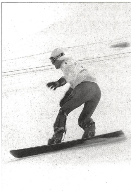
... à la recherche du meilleur temps dans une tenue plutôt classique!

Deux «experts» en la matière ont philosophé sur ce thème dans les colonnes du plus important journal d'outre-Sarine. Il est évident écrivait l'«expert en ski» que si les snowboarders que l'on voit se tortiller et bondir sur les pistes tels de petits enfants devaient se mesurer aux skieurs, ils seraient bourrés de complexes. Celui qui peste contre les snowboarders a un problème certain avec la jeunesse contrairement à l'«expert en snowboard». Rien que ça! Ce même esprit d'intolérance qui règne dans les plus hautes sphères des deux fédérations internationales les a conduites à la guerre froide. A Davos, on pouvait voir divers autocollants aux slogans assassins, comme par exemple celui-ci: «Ne donne aucune chance à la FIS». Mais s'il vous plaît!... Comme chacun le sait, nous voulons pratiquer du beau sport, avec fair-play!