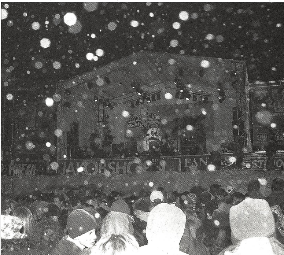
Hip-hop et snowboard font bon ménage. Le groupe «Dog eat Dog» en concert.