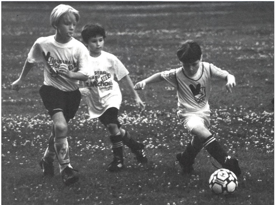
Reconnaître l'essentiel: enregistrer et traiter les informations.

Le principe de base des jeux d'équipe que sont le basketball, le handball et le football est qu'il faut marquer des points en atteignant une cible plus ou moins grande (le but, le panier) tout en empêchant l'adversaire d'en marquer. Le basketball ne devrait occasionner aucun contact physique, ou du moins très peu de contact, avec l'adversaire, tandis que le football et le handball demandent un engagement physique plus considérable (situation de duel). Le volleyball, quant à lui, est un jeu de renvoi collectif, qui fait