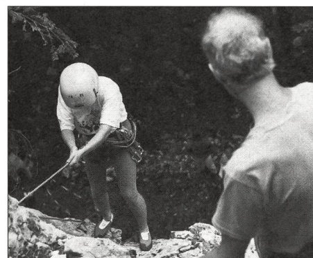
Le conseiller a choisi d'endosser des responsabilités pédagogiques.