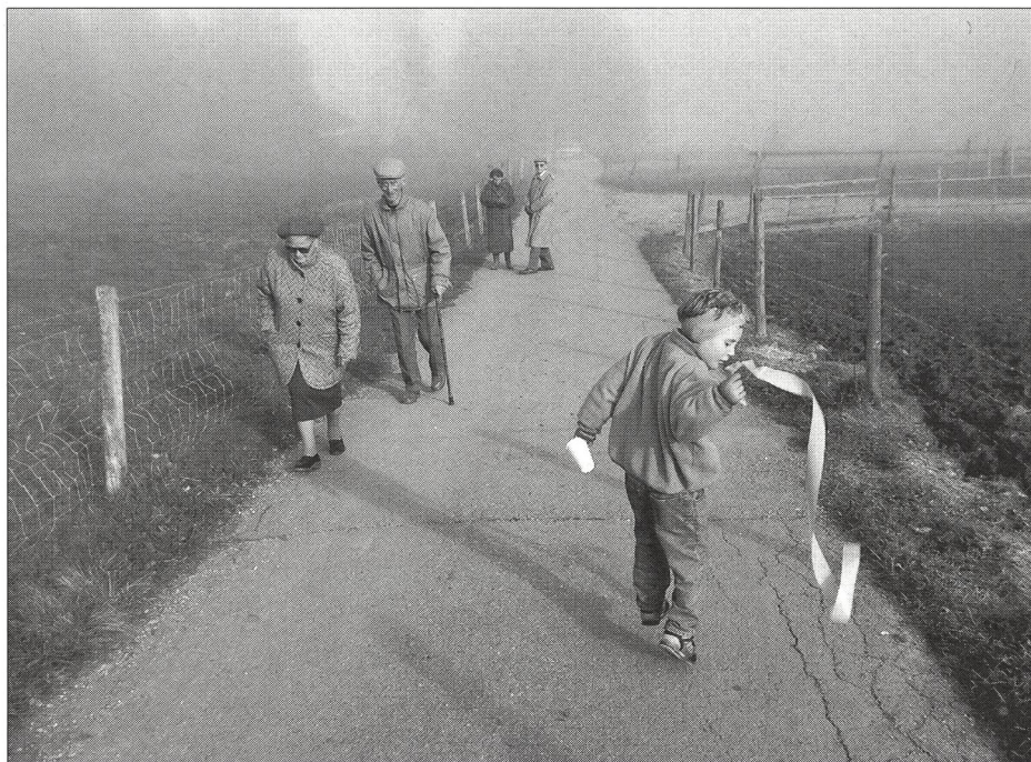
L'enfant, un être en devenir.

L'impatience de l'adulte a souvent pour effet d'éteindre prématurément la petite flamme du progrès qui brûle à l'intérieur de chaque jeune. Souvent il m'est arrivé à moi-même d'éliminer, en pensée, de jeunes nageurs/nageuses de la liste des vainqueurs en puissance, de la