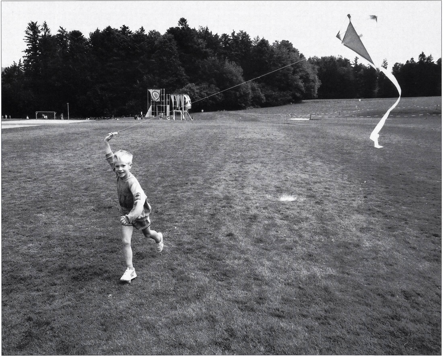
Laisser du temps à l'enfant... (Voir article pp. 14 à 17.)