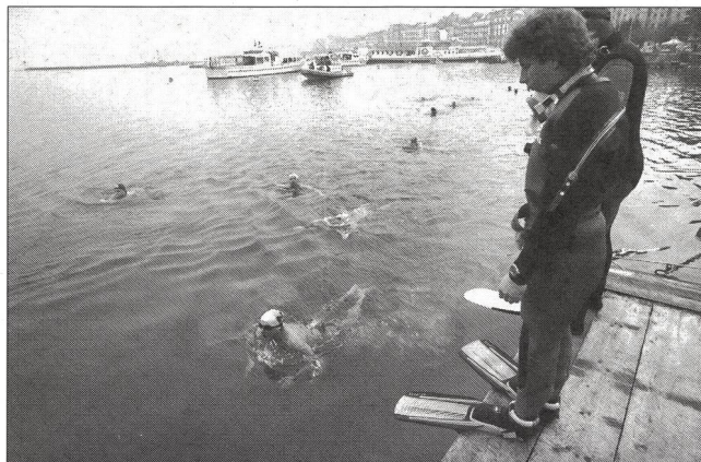
Nageurs sous haute surveillance!