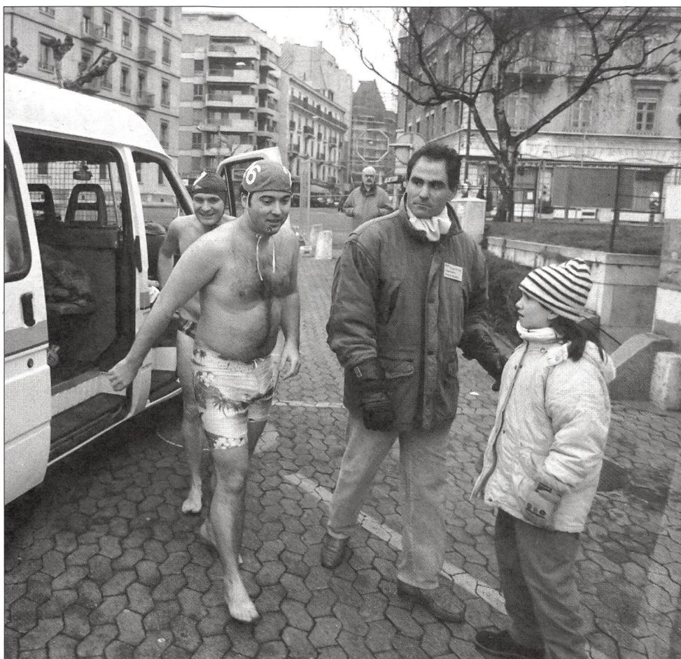
Regards inquiets mais pleins d'admiration pour l'intrépide.