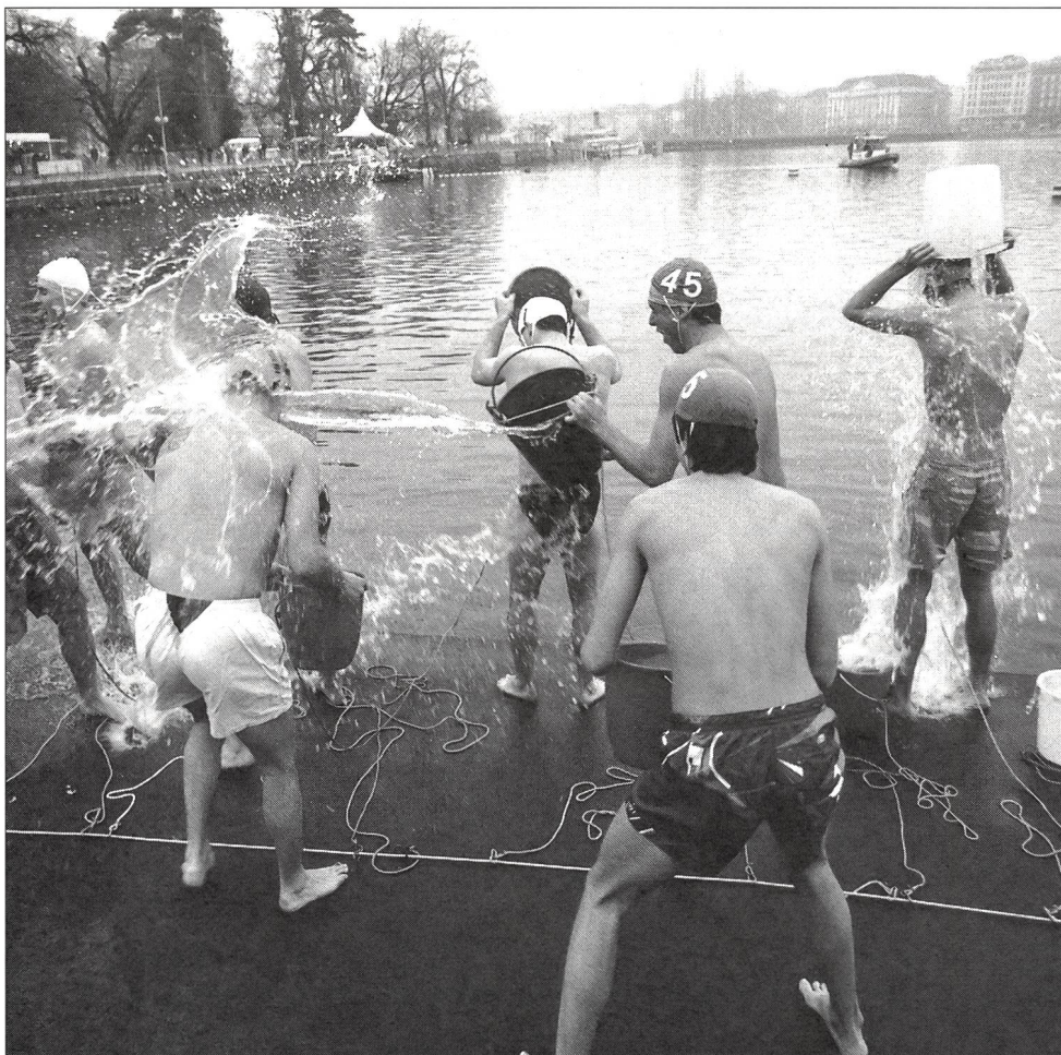
Bien se mouiller en s'amusant...