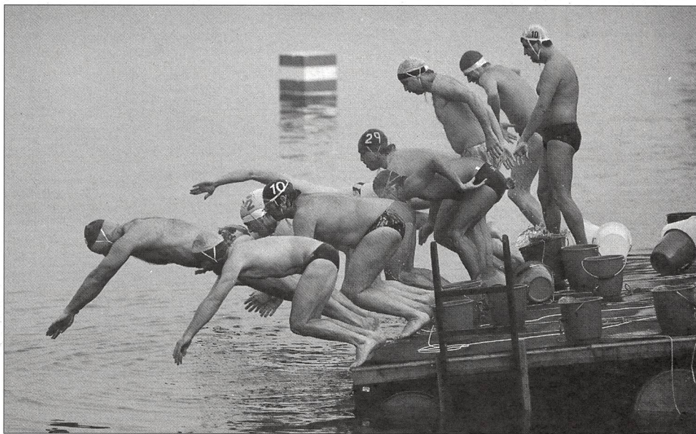
Le point de non-retour...