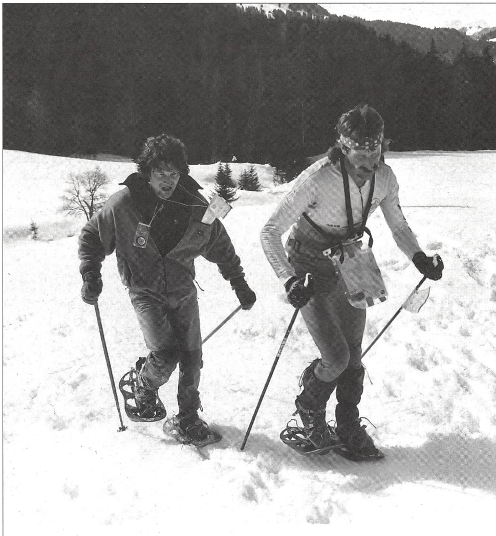
Les coureurs chevronnés apprécient le paysage valonné des Préalpes, terrain idéal pour la CO.