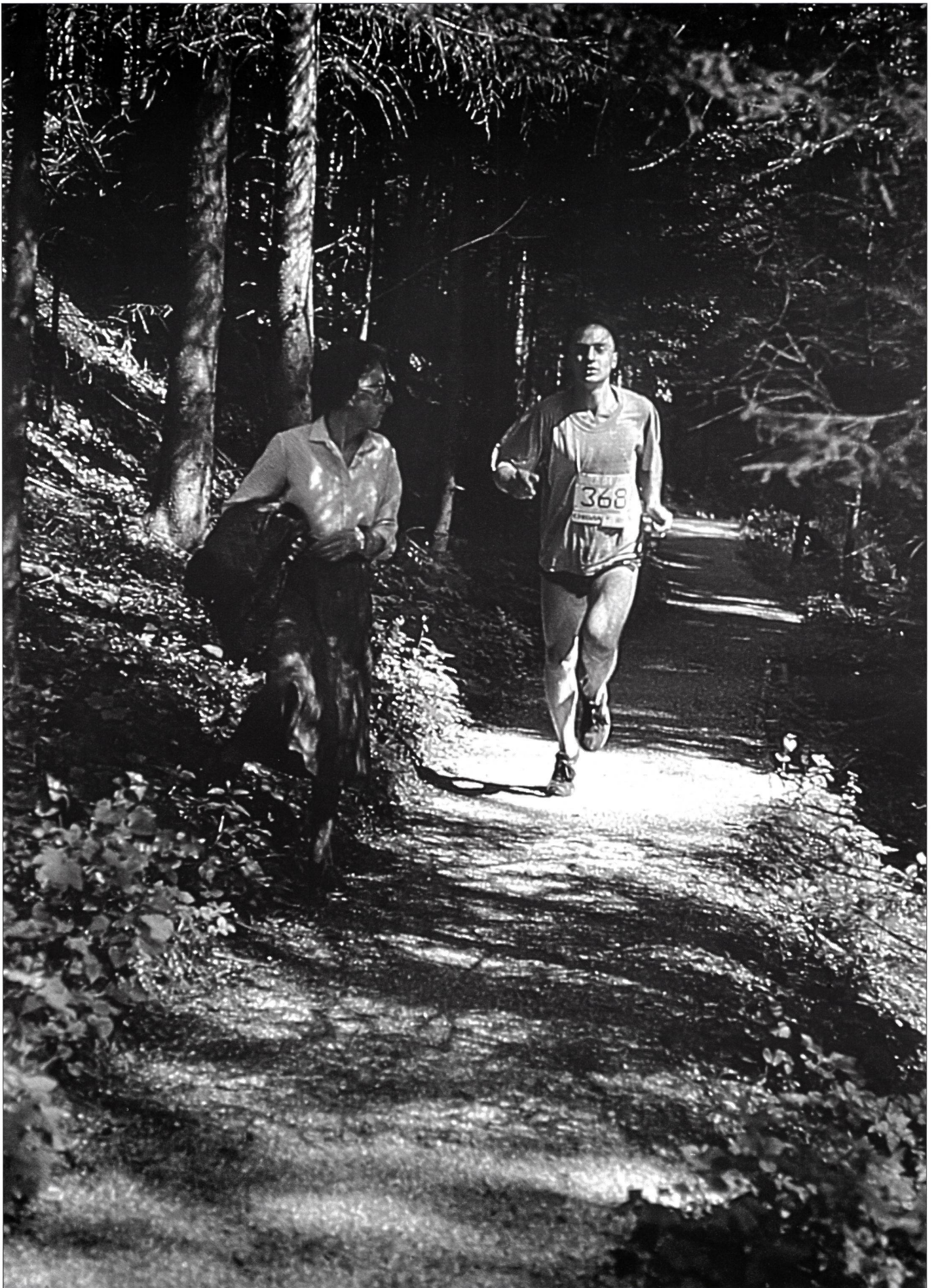
L'appel de la forêt, au printemps.